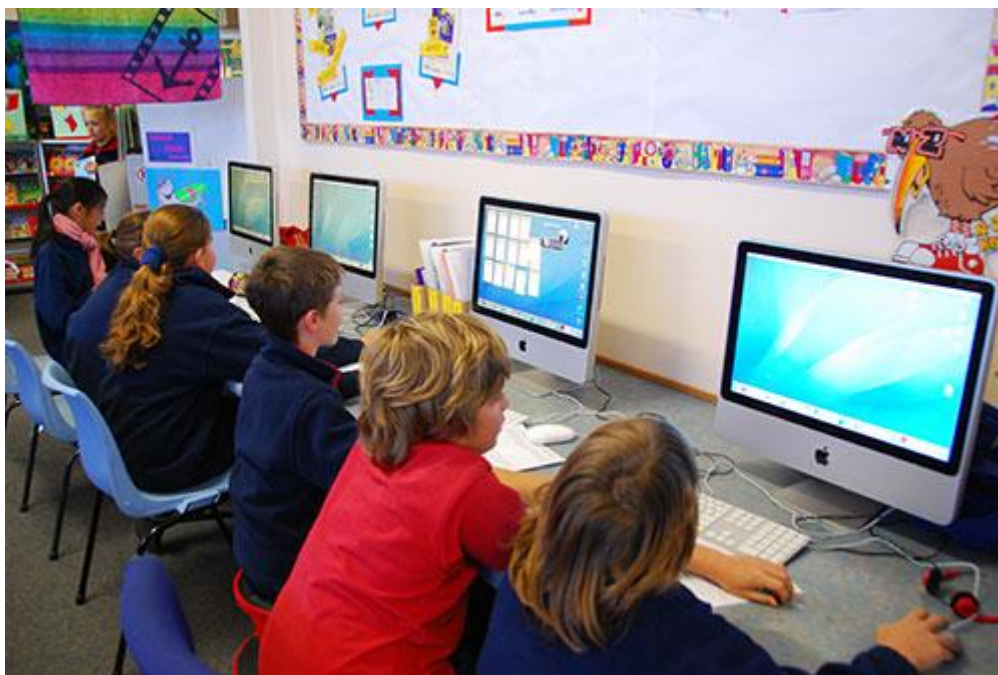
Slika 3- Nove pismenosti kao dio obrazovnog procesa

Gotovo da možemo zaključiti da su se, svojim konstantnim razvojem, informacijska pismenost i obrazovanje sasvim prirodno i bez nekog posrednog ili neposrednog utjecaja susreli u točki gdje se međusobno isprepliću i upotpunjuju te na različite načine načine dopunjavaju svoje definicije i načine djelovanja. Upravo iz tog razloga njihova funkcija je postala neodvojiva te su se ta dva područja i više nego uspješno integrirala jedno u drugo.