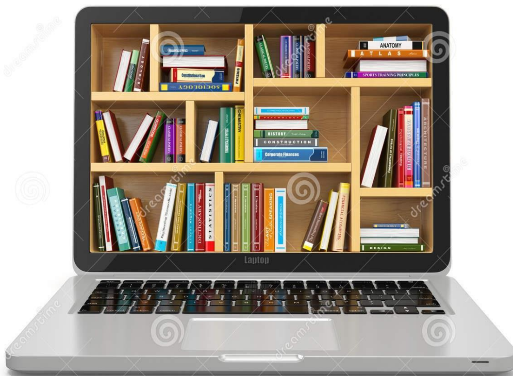
Slika 2- Novi oblik informacija- nove vrste pismenosti

Može se zaključiti da su pojmovi informacijske i informatičke pismenosti u kontekstu svoje biti i funkcije različiti pojmovi i nikako nisu sinonimi. Ali međusobno su vrlo povezani i u posebnom odnosu međuovisnosti, a kako vrijeme prolazi postajat će nam samo još jasnije da ovi pojmovi ne mogu funkcionirati jedan bez drugoga.