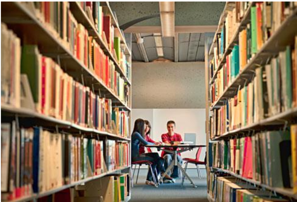
Slika 4- Istraživački rad u manjoj skupini- početak informacijske pismenosti

Naravno da je bitna stavka ovog modela, kao i mnogih drugih, da se on može prilagoditi različitoj dobi korisnika. Ako malo proučimo ovih šest pravila, lako možemo zaključiti da je ovaj model zapravo dosta sličan klasičnom poučavanju informacijske pismenosti o kojemu se govori kroz veći dio rada i vjerojatno je upravo ta činjenica razlog sveopće prihvaćenosti ovog modela poučavanja.