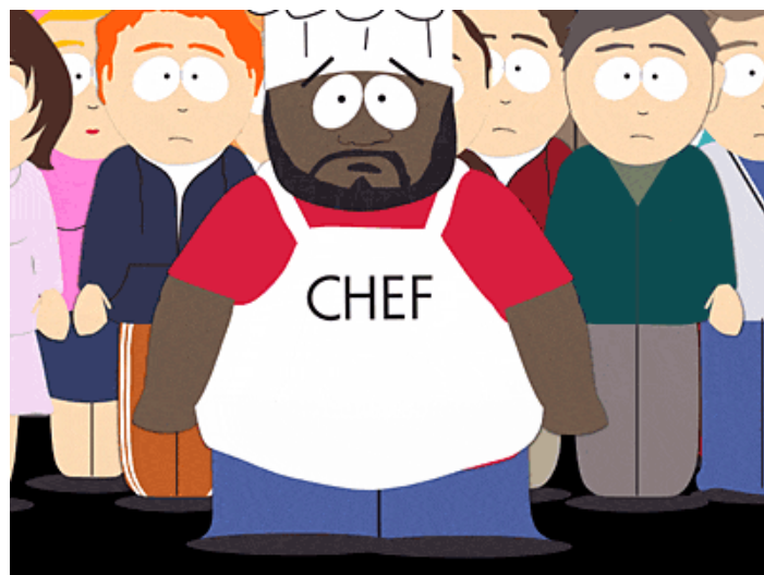
Slika II. Chef s još nekoliko odraslih likova iz South Parka

southparkovskoga naslova Cartmanova mama je prljava drolja ( Cartman's Mom is a Dirty Slut ), u kojoj dječak Cartman traži svojega oca. Prvo, uvjeren da je riječ o Indijancu (pripadniku crvene rase), preoblači se i boja lice kako bi izgledao kao "naive American" umjesto "native American" (sarkastična igra riječima – "naivni" umjesto "izvorni" Amerikanac, nap. a. ), a kasnije se, kad misli da mu je Chef otac, preodijeva u crnca. Drugom prilikom Kyle pokušava upasti u košarkaški tim, ali mu to ne uspijeva pokraj visokih crnaca koji su mu rivali, što ga deprimira, zbog čega mu dr. Biber iz Trinidadskoga medicinskoga centra predlaže "negroplastiku" kako bi postao crn i visok. Ciničan stav prema rasnim pitanjima pokazuju i sarkastičnim ponavljanjem "politički korektnog" naziva za crnce, Afro-Amerikanci ( Afro-Americans ), kao i što se pogrdom riječju "crnčuga" ( negro ), kako napominje Richard Hanley, u South Parku podjednako služe i crnci i bijelci, primjerice u epizodi Ludi bogalji ( Krazy Kripples ). 87 Na njihovom udaru zna se naći i žuta rasa, recimo, kao kada su u epizodi Gotovina za zlato ( Cash for Gold ) Kineskinje koje vode trgovinu s nakitom Cash for Gold prikazane kao prevarantice.