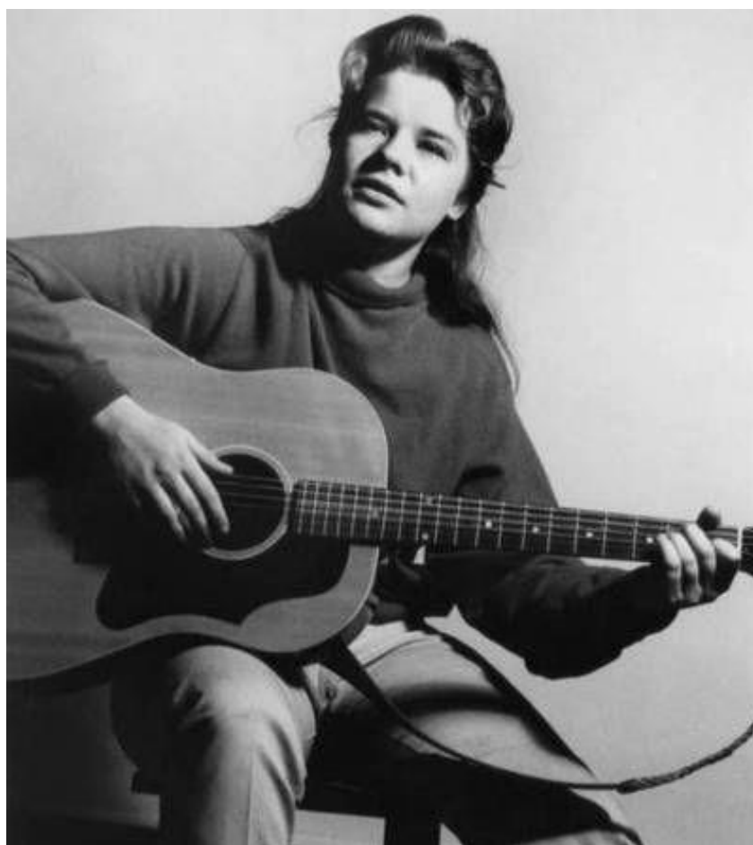
Slika br. 4 „Janis Joplin, 1962.“