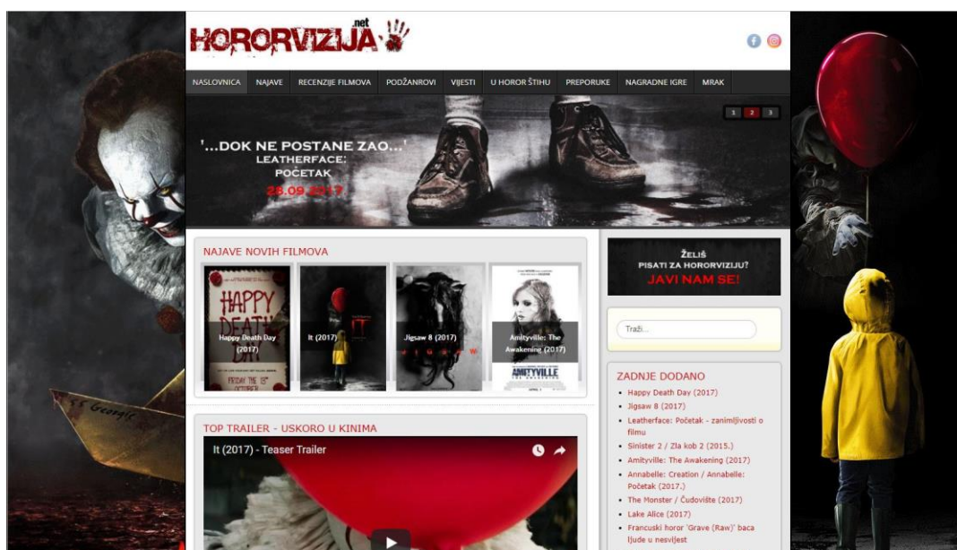
Slika 16: Prikaz sučelja web-stranice hororvizija.net.

HorrorHR nije jedina web-stranica koja se bavi tematikom horor filma. 2012. godine pojavila se web-stranica pod nazivom Hororvizija . Autor i administrator stranice je Josip Brkić, a stranica je također nastala iz prvotne forme bloga, iz razloga što su uređivačke mogućnosti na platformama za web dizajn bile i ostale veće. Stranica se isključivo bavi horor žanrom i to recenzijama horor filmova, ali i zanimljivostima koje imaju veze sa žanrom.