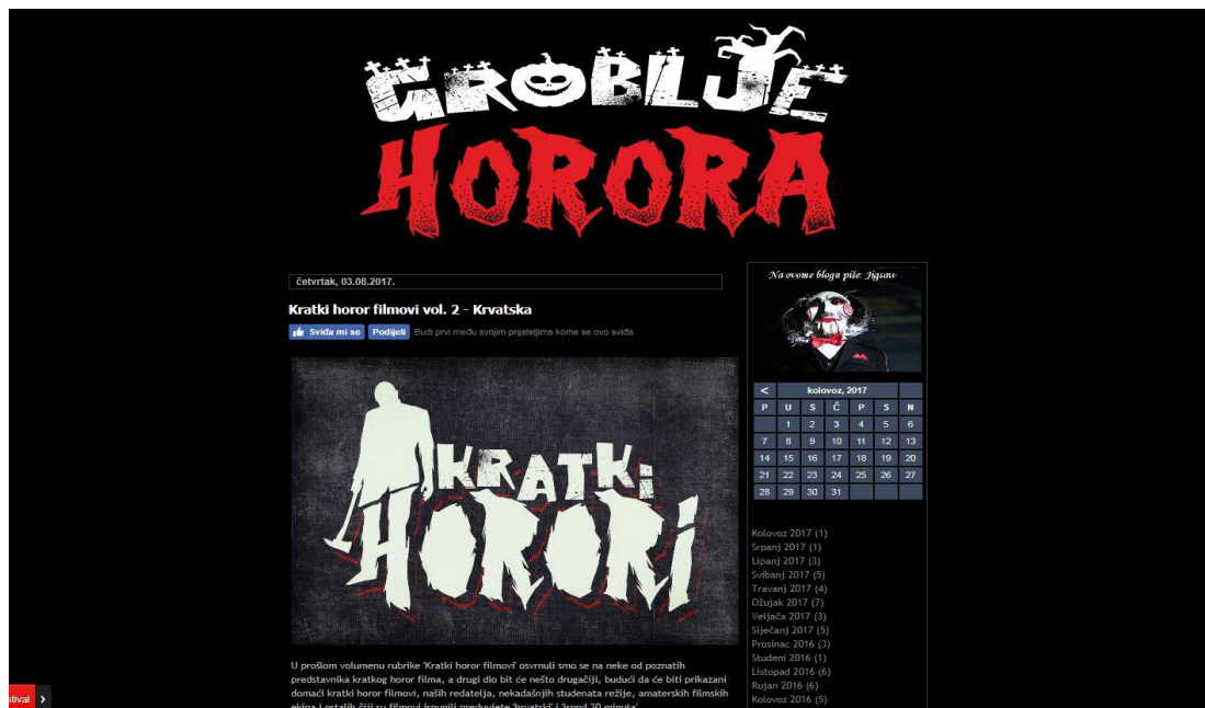
Slika 18: Prikaz sučelja bloga recenzijefilmova.blog.hr.