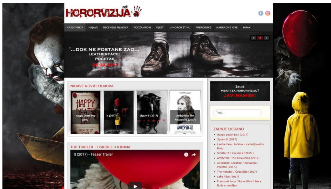
Slika 16: Prikaz sučelja web-stranice hororvizija.net.

HorrorHR nije jedina web-stranica koja se bavi tematikom horor filma. 2012. godine pojavila se web-stranica pod nazivom Hororvizija . Autor i administrator stranice je Josip Brkić, a stranica je također nastala iz prvotne forme bloga, iz razloga što su uređivačke mogućnosti na platformama za web dizajn bile i ostale veće. Stranica se isključivo bavi horor žanrom i to recenzijama horor filmova, ali i zanimljivostima koje imaju veze sa žanrom.