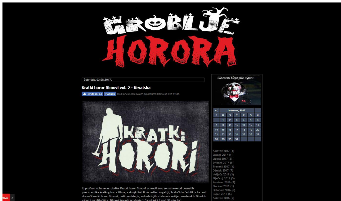
Slika 18: Prikaz sučelja bloga recenzijefilmova.blog.hr.