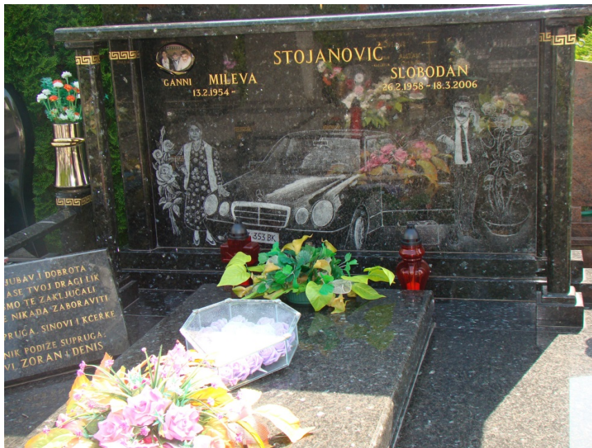
Slika 12: Nadgrobni spomenik (26. svibnja 2017.)

O smrti kao saveznici kiča moglo bi se napisati posebno poglavlje. Danas su grobnice prepune simbola koji su nešto kao posljednji iskaz štovanja uspomene na pokojnika, samo izražen lošim ukusom... a možda je prodor lošeg ukusa na područje smrti započeo upravo s gubitkom poštovanja prema istoj. ( vidi sliku 12 )