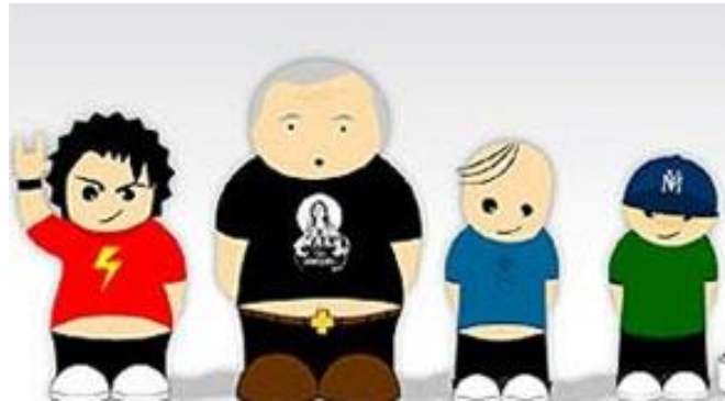
Slika 7. Originalni izgled Zlikavaca u prvoj sezoni

radija i kasnije Radija 101 od 1985. godine... Etiketu 'domaći South Park' držim uobičajenom linijom manjeg otpora naše inertne kritičke javnosti. Sve domaće je najlakše opisati kao verziju nečeg inozemnog pa onda s tim i uspoređivati uz standardni zaključak: inozemni, obično američki (original) je bolji od (domaće) 'kopije'. Zločesta djeca nastala su mnogo prije South Parka . Isti je diskurs, razlika je samo u mediju", ističe Pirš.