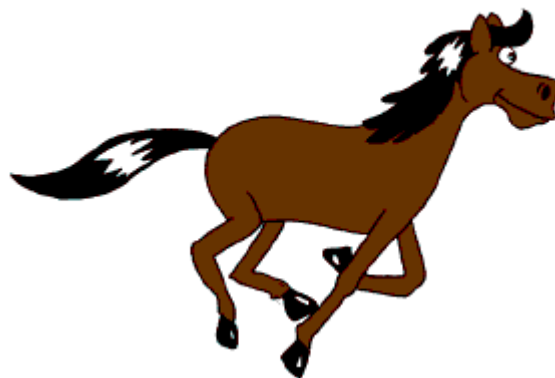
Slika 3. Primjer tradicionalne ili cel animacije – konj animiran rotoskopiranjem s fotografija Eadwearda Muybridgea iz XIX. stoljeća

papiru. Da bi se stvorila iluzija pokreta, svaki se crtež neznatno razlikovao od onoga prije. Crteži animatora bi se precrtavali ili fotokopirali na prozirne listove acetata zvane cels , koje bi se ispunjavalo bojom u dodijeljenim tonovima na strani suprotnoj od linijskih okvira. Gotovi listovi bi se pojedinačno fotografirali na rolu igranog filma s obojanom pozadinom putem tzv. rostrum kamere. 34 Ajanović napominje kako se radi o najuobičajenijoj tehnici u proizvodnji animiranih filmova, čiji su rezultat naslovi koje većina poistovjećuje s pojmom "crtani film". Cel animacija, i to pojednostavljena, bila je isključivo sredstvo za realizaciju mađarskog crtića Gustav te niza sezona američkog serijala Simpsoni , dok je XXI. stoljeće donijelo postupni prijelaz i kombiniranje sa suvremenom tehnikom – računalnom animacijom . Tako su dugometražni Simpsoni Film (The Simpsons Movie) iz 2007. i epizode toga serijala od 19. sezone nadalje izrađeni u tehnici tzv. cel sjenčanja (cel-shaded animation) , poznatoj i kao Cel shading ili Toon shading , vrsti takozvanog ne-fotorealističnog renderiranja oblikovanog kako bi računalna grafika izgledala kao da je rukom nacrtana. Cel sjenčanje često se koristi u cilju imitiranja stila stripa ili "crtića". 35