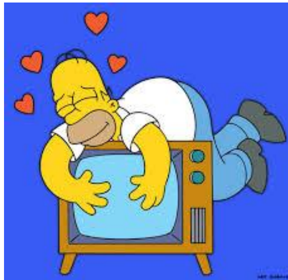
Slika 14. Homer Simpson obožava televiziju i ovisnik je o njoj

Dijametralno suprotan primjer su Simpsoni kojega, s medijske strane, označava ovisnost glavnoga lika, Homera Simpsona, o televiziji ( slika 14. ), a nekoliko njegovih tipičnih rečenica najbolje pokazuju njegov i odnos autora serije prema tom pitanju. U epizodi Wild Barts Can't Be Broken , Homer, dok sjede pred televizorom, kaže Marge: "Idemo vidjeti što ima na televiziji, da znamo što treba misliti jer ona misli umjesto nas", a kada Marge ne upali odmah TV, Homer ljutito podvikne: "Marge, pali TV, počinjem razmišljati!" U epizodi Kada je Flanders promašio (When Flanders Failed) on prekora supругu: "Vidiš, Marge, rugaš se televiziji, a ona ti pomaže. Mislim da nekome duguješ malu ispriku".