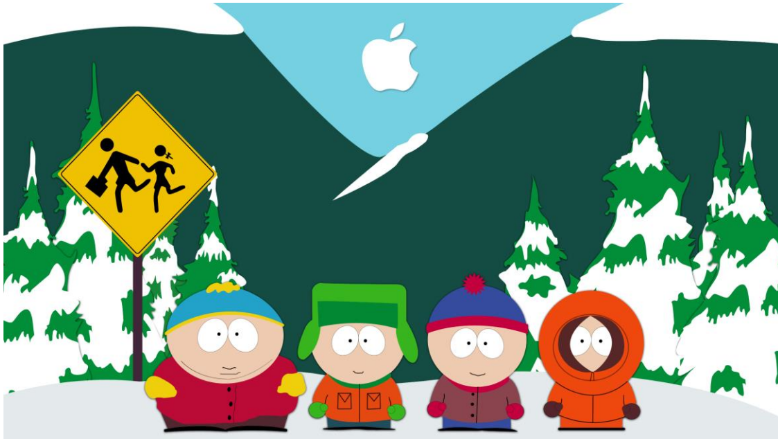
Slika 6. Cartman, Kyle, Stan i Kenny, glavni likovi u kontroverznom američkom animiranom serijalu South Park

sitcoma, zasnovanog na tim likovima. South Park (slika 6.) službeno je zaživio 13. kolovoza 1997., a prva epizoda pod indikativnim naslovom Cartman prima analnu pretragu ( Cartman Gets an Anal Probe ) umnogome postavlja njegovu estetiku i razinu humora. Uvodna špica s pjesmom koju izvodi bend Primus nije se znatnije mijenjala tijekom 17 godina, izuzev dijela teksta kojega jako brzo i nerazumljivo mumlja lik Kennyja, a čiji lascivni sadržaj producenti otkrivaju javnosti tek naknadno.