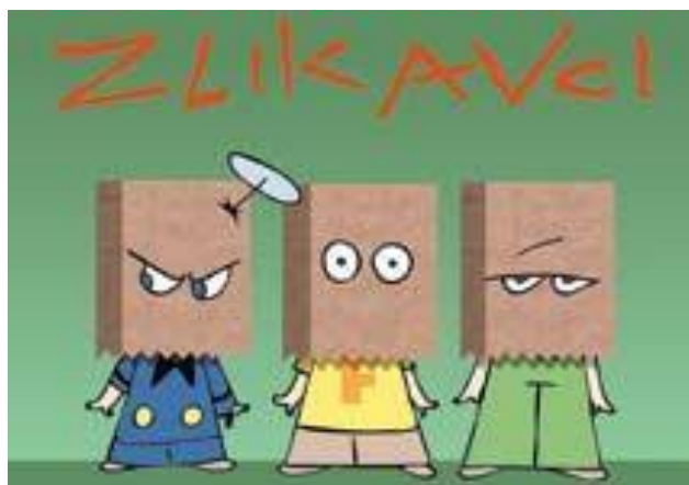
Slika 8. Izmišljeni izgled Zlikavaca u drugoj i posljednjoj sezoni

Ukupno je snimljeno 40 epizoda u trajanju od devet do dvanaest minuta podijeljenih u dvije sezone. Prva je realizirana od 26. kolovoza do 24. prosinca 2004., a druga od 7. listopada 2005. do 26. svibnja 2006. godine. Uvodnu špicu uvijek kao glazbena podloga prati žestoka pjesma znakovitog naslova Damage, Inc. ( damage na engleskom jeziku znači "šteta", nap. a. ) u izvedbi slavne američke heavy metal skupine Metallica. Vjerojatno u nakani da ublaže usporedbu sa South Parkom , autori i producenti u drugoj su sezoni promijenili animatorsku kuću, a drukčiji vizualni izgled Zlikavaca – po mnogim gledateljima, slabiji nego originalni – potpisao je Studio Milan Trenc iz Zagreba ( slika 8. ).