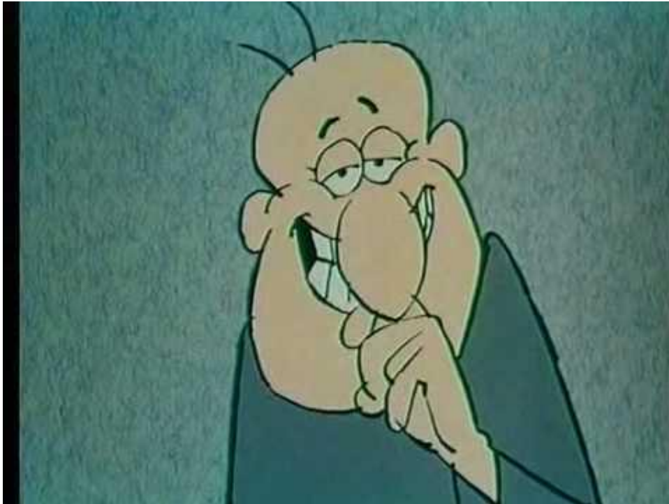
Slika 4. Popularni mađarski animirani lik Gustav (Gusztav)

i često nesretni lik Gustava koji vodi prilično običan, "siv" život, a svakodnevnu mu rutinu "razbijaju" različita događanja u kojima u pravilu izvlači "kraći kraj".