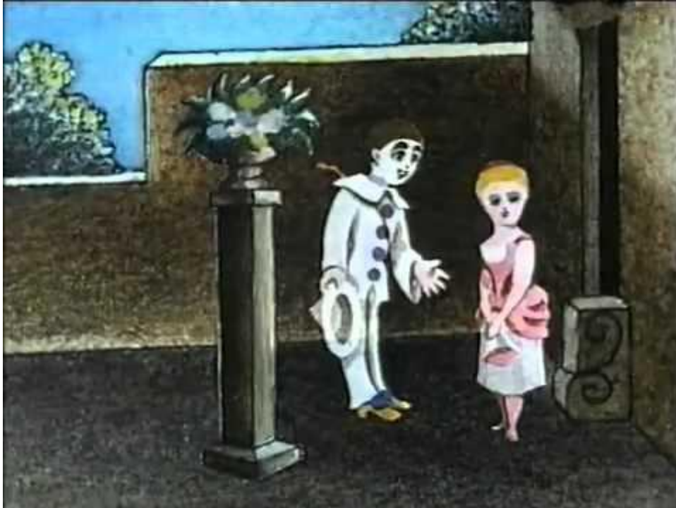
Slika 2. Scena iz francuskoga animiranoga uratka Pauvre Pierrot autora Charlesa-Émilea Reynauda iz 1892. godine

( Humorous Phases of Funny Faces ) iz 1906. često navodi kao prvi pravi animirani film snimljen u standardnoj filmskoj slici, a njega kao prvoga animatora.