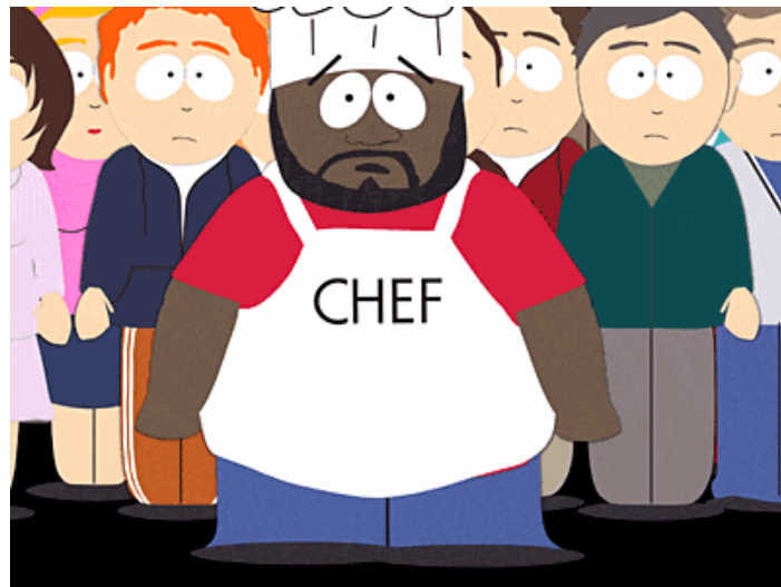
Slika II. Chef s još nekoliko odraslih likova iz South Parka