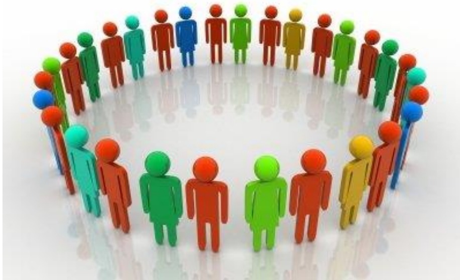
Slika 1. Ilustracija raznolikosti jednog ljudskog društva

Za početak treba pokušati što preciznije determinirati društvo (slika 1.) i društvenu zbilju ili društvenu stvarnost , pojmove koji su naoko razumljivi sami po sebi, no nije lako postaviti njihove univerzalno važeće definicije. Razlog dobrim dijelom leži u tvrdnji Deana Duda kako je "društvo zapravo složena mreža u kojoj se nalaze različite interesne grupe", iz čega proizlazi kako je i društvena zbilja u najmanju ruku jednako, ako ne i više, složena od samoga društva. Duda nadalje upozorava: "Njihovi se međusobni odnosi (interesnih grupa, nap. a. ) pokazuju kao odnosi moći, kao strukture dominacije i potčinjenosti, kao mjesto neprestane borbe i sukoba. Moć u društvu djeluje tako da se interesi jedne klase ili grupe nameću i pritom nastoje prikazati kao opći interesi". 3 Upravo takvi pokušaji neke vladajuće i dominantne klase u određenom društvu nerijetko su bili predmetom izrugivanja u promatranim animiranim serijalima za odrasle, što će biti prikazano u drugom, praktičnom dijelu rada.