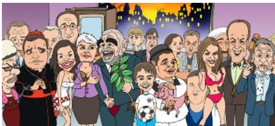
Slika 9. Dio brojnih likova u hrvatskom animiranom serijalu Laku noć, Hrvatska