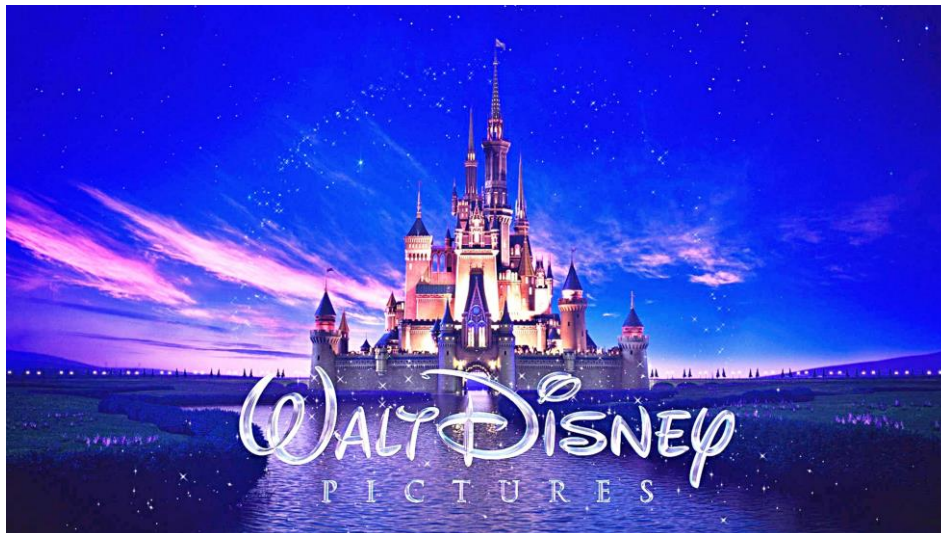
Slika 10. Logo svjetski poznate filmske kuće Walt Disney Pictures

Jedan od prvih velikih filmskih pregalaca koji je, prema Ajanoviću, svoju odabranu umjetničku formu vidio kao realističan medij bio je Amerikanac Robert Joseph Flaherty, čuveni američki dokumentarist (1884.–1951.) koji je svoje metode rada smatrao bilježenjem realnosti na filmsku vrpcu. Za razliku od Flahertyja, škotski pionir dokumentaraca John Grierson (1898.–1972.), kojega često tituliraju i kao "oca britanskoga i kanadskoga dokumentarnoga filma", zastupao je tezu da je realizam interpretacija suvremenosti i da realno dolazi iz dramatiziranja svakodnevnoga. Što se tiče animiranoga filma, tek će Walt Disney ( slika 10. ) u potpunosti raskinuti s njegovom tradicijom kao oživljenim stripom. Središnjom idejom svojega estetskoga sustava, idejom o uvođenju filmskog realizma u animaciju, Disney je ostvario jedan od najvažnijih koraka naprijed u povijesti animiranog filma. To je crtani realizam , praksa poznata u Disneyevu studiju kao life-quality animacija ili, terminologijom samog Disneya, "maksimalna uvjerljivost". 73 Na tim zasadama posljednjih desetljeća razvio se čitav jedan svijet animacije kojemu više sadržajem nego izgledom pripadaju i promatrani serijali.