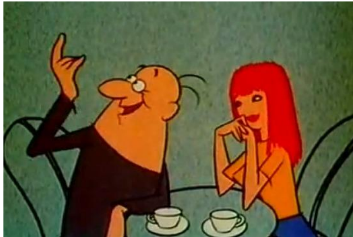
Slika 13. Gustav u jednom od brojnih neuspješnih pokušaja udvaranja

život – Gustavus and a Long Life ), kao dokone kućanice, na primjer kada ga u epizodi Lovac Gustav ( Gustav The Hunter ) njegova supruga na početku ispraća u lov ili u njima vidi samo zgodna stvorenja ( Gustav se želi oženiti – Gustav Wants to Marry ; slika 13.). Veće razlike među analiziranim serijalima utvrđene su u njihovom odnosu prema medijima, osobito masovnim.