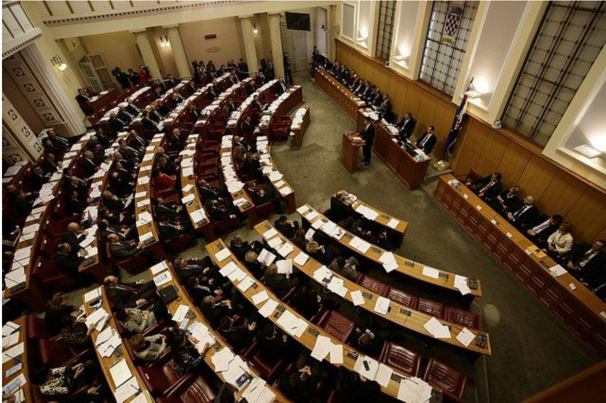
Slika – Hrvatski Sabor i političari