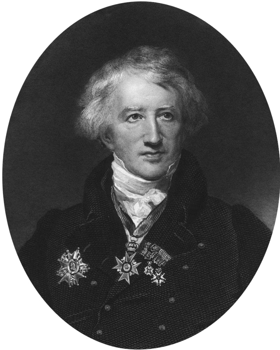
Slika 5. George Cuvier