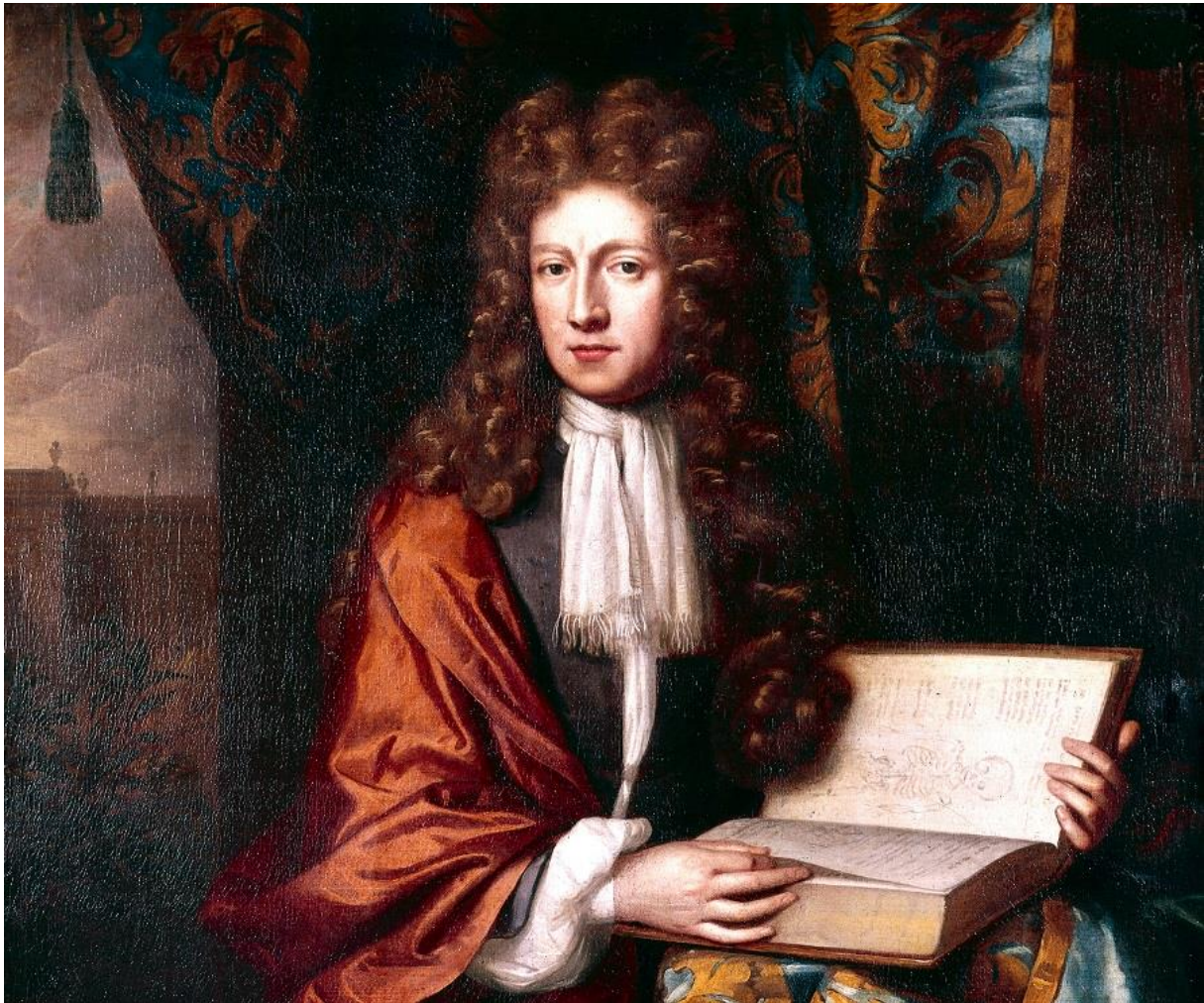
Slika 4. Robert Boyle – naslikao Johann Kerseboom