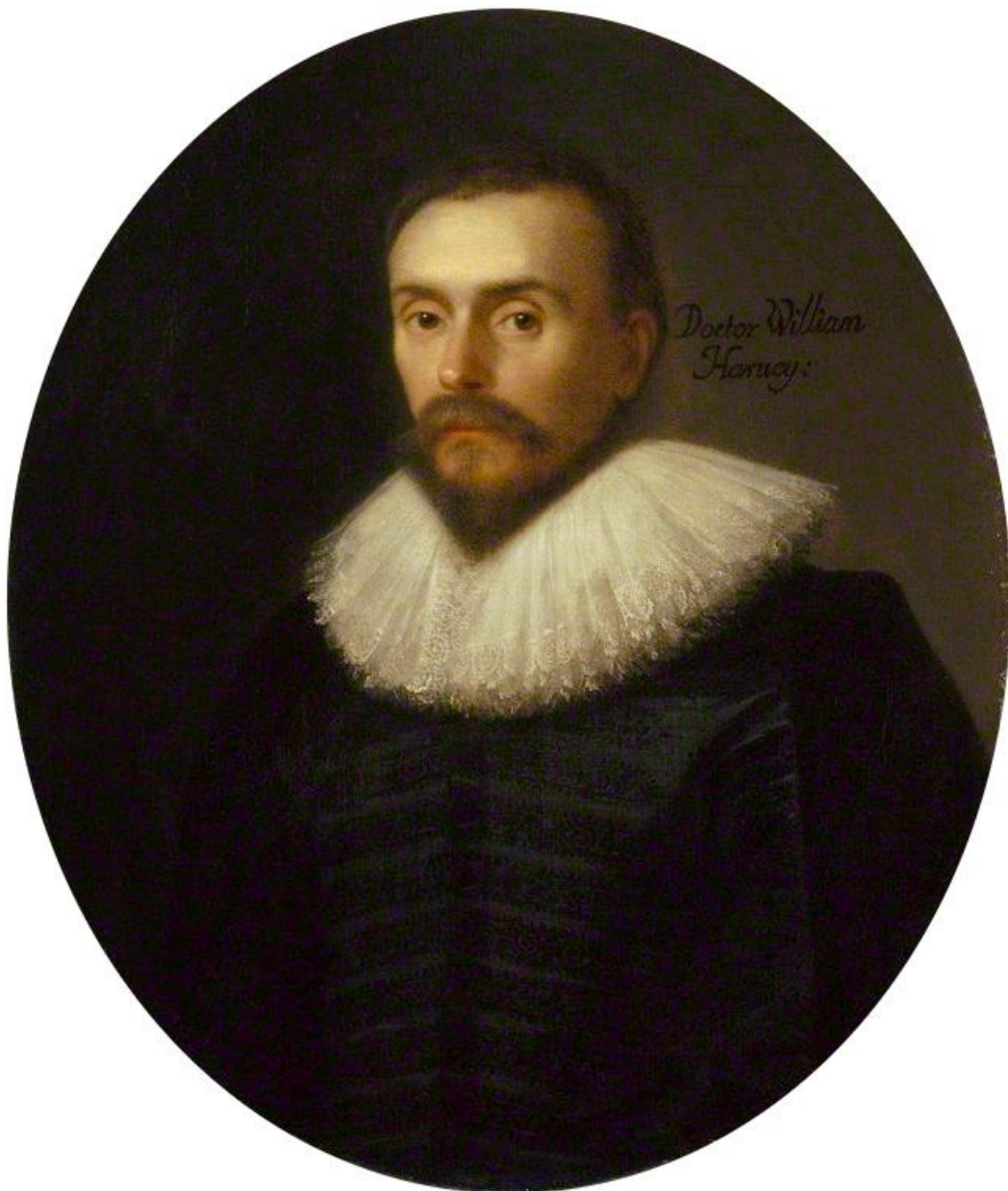
Slika 3. William Harvey

popustio pritisak, nakon što je krv u ruku, a ne imala mogućnost vratiti se do srca, postala bi crvena, što je on objasnio kako je krv pod određenim pritiskom koje je tijesna marama potpuno zaustavila, navodi Bynum (2012). To je također pokazalo da oslobađanjem pritiska krv prolazi kroz arterije, ali ne može izaći kroz vene, a s obzirom da je dugo proučavao srce, došao je do zaključka da u veoma kratkom periodu kroz srce prođe više krvi nego što je ima u cijelom organizmu, stoga krv mora ići iz srca u svakom otkucaju, kroz arterije, kroz vene i opet u srce kako bi se mogao nastaviti novi ciklus te je upravo taj proces stoga nazvao cirkulacijom (Bynum 2012).