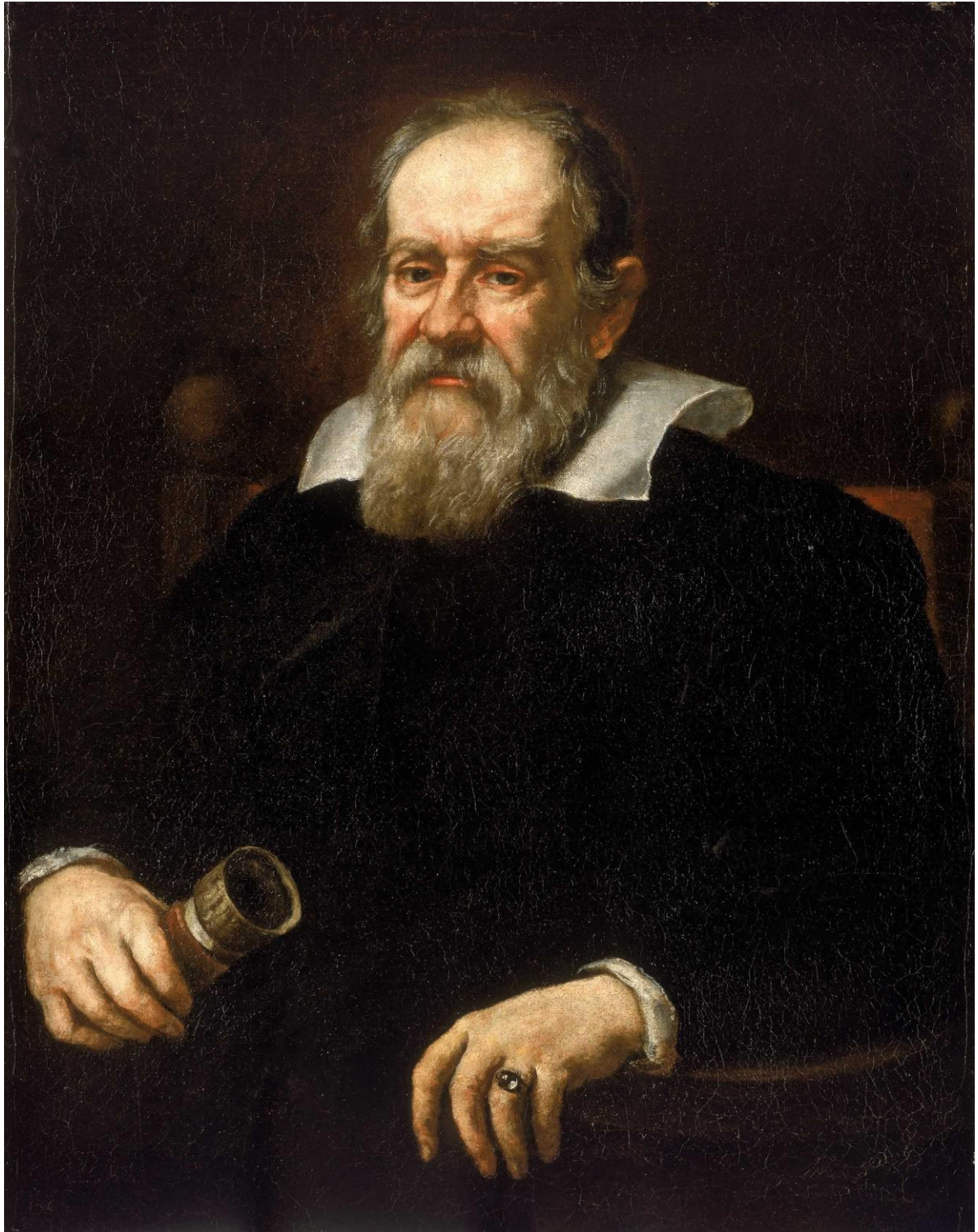
Slika 1. Galileo Galilei – naslikao Justus Sustermans 1636. godine

protestantizmom, s jedne strane, a s druge strane prisvajala je nove pristaše u novootkrivenim zemljama, a usporedno s tim mnogi katolički intelektualci težili su učenju nove filozofije i prirode, odnosno onoga što mi danas nazivamo znanosti, kako ističe Sullivan (2005).