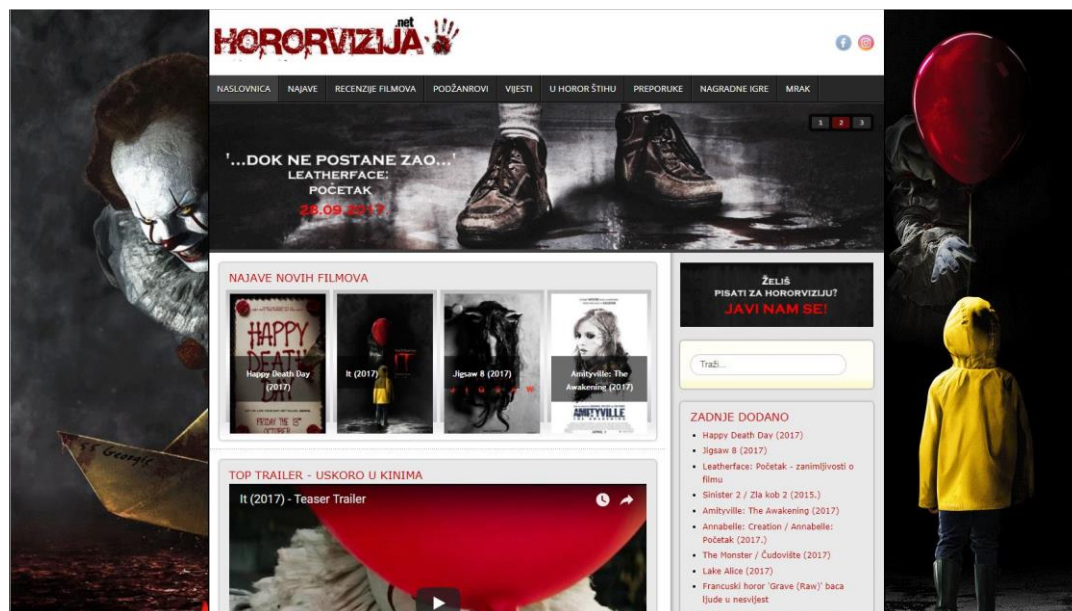
Slika 16: Prikaz sučelja web-stranice hororvizija.net.

HorrorHR nije jedina web-stranica koja se bavi tematikom horor filma. 2012. godine pojavila se web-stranica pod nazivom Hororvizija . Autor i administrator stranice je Josip Brkić, a stranica je također nastala iz prvotne forme bloga, iz razloga što su uređivačke mogućnosti na platformama za web dizajn bile i ostale veće. Stranica se isključivo bavi horor žanrom i to recenzijama horor filmova, ali i zanimljivostima koje imaju veze sa žanrom.