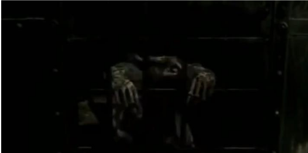
Slika 14: Veliki štakor u filmu 'Infekcija' (2003.) r. Krsto Papić

U filmu se nalazi prepoznatljiva glumačka postava, Leon Lučev u glavnoj ulozi pisca Ivana Gajskog, Sven Medvešek u ulozi profesora Boškovića, Lucija Šerbedžija u ulozi Sare, Filip Šovagović u ulozi gradonačelnika te pored navedenih – Božidar Alić, Ivo Gregurević, Zlatko Vitez, Vanja Drach i drugi. Film, iako je prvotno snimljen 2003., distribuirao se tek 2005. godine zbog rezanja i prilagođavanja određenih scena te je u kraćoj verziji prikazan u kinima.