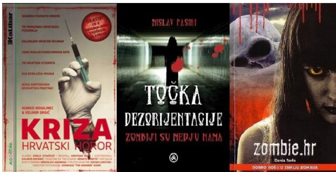
Slika 3: Naslovnice romana 'Krizi - hrvatski horor' (2010.), 'Točka dezorijentacije' (2010.) i 'Zombie.hr' (2013.)