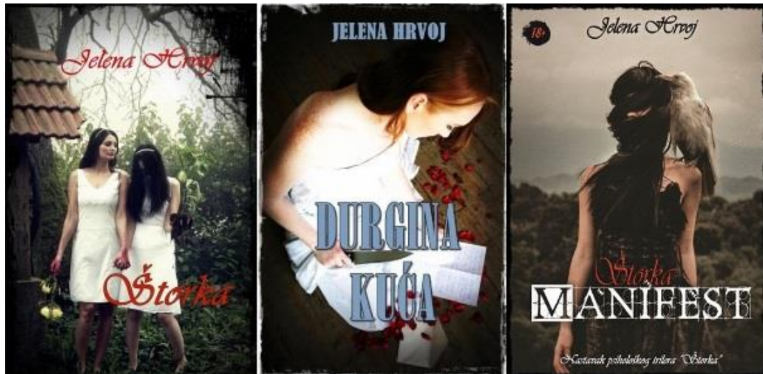
Slika 1: Naslovnice romana 'Štorca' (2014.), 'Durgina kuća' (2016.) i 'Štorca Manifest' (2017.) autorice Jelene Hrvoj

Štorke krene u ubilački pohod pedofila, silovatelja i ubojica, gdje i sama postane dio posljednje navedenih. Radnja je opisana u dva vremenska perioda, a široka karakterizacija likova te konceptualnost sadržaja omogućili su nastavak priče pod nazivom Štorca Manifest , romana objavljenog 2017. godine (Hrvoj, 2014.).