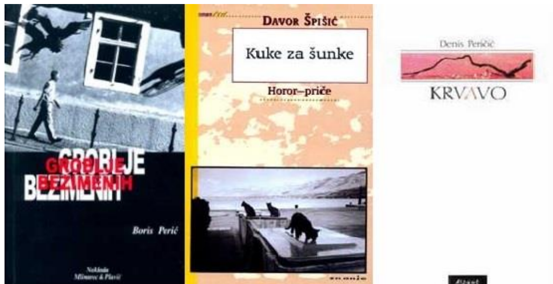
Slika 5: Naslovnice zbirke priča 'Groblje bezimernih' (2003.), 'Kuke za šunke' (2004.) i 'Krvavo' (2004.)

Rosamund, Sestre sepije, Cornflakes, Da ti gatam, Baranja Inn te Osveta Mojmira Bunjače (Špišić, 2001.).