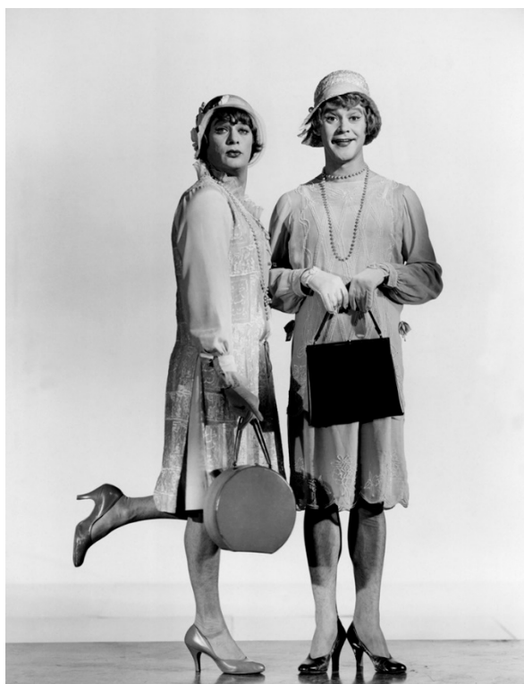
Slika 27: Tony Curtis i Jack Lemmon u filmu Neki to vole vruće.