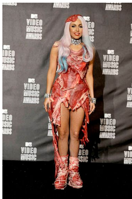
Slika 25: Haljina od mesa Lady Gage.