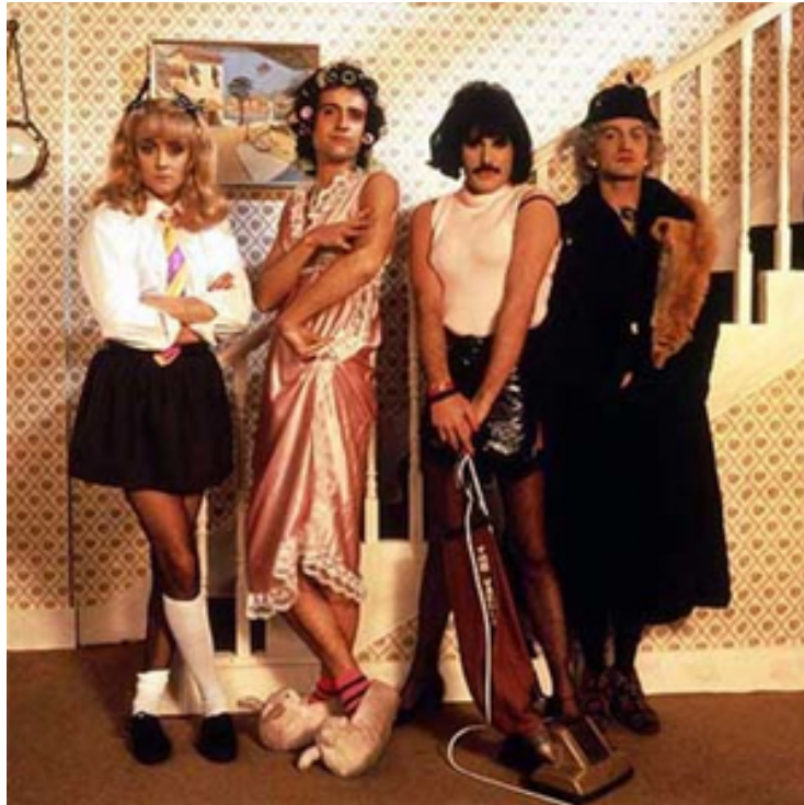
Slika 24: Grupa Queen u spotu I Want To Break Free.