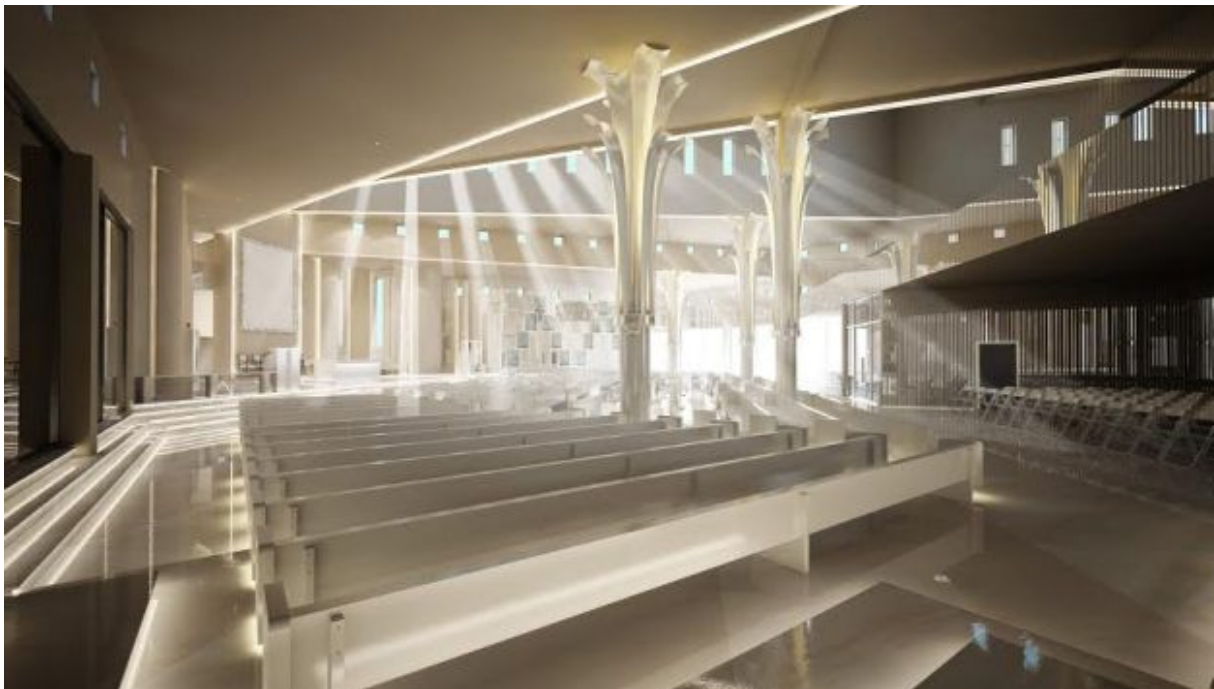
Slika 13: Interijer crkve u Kninu.

crkvi koje su njime pretrpane. Međutim, kršćanski kič nije usamljena pojava niti je specifičan problem jer danas većina onoga što se proizvodi i nudi spada u loš ukus. Kršćanski se kič ne temelji na formalnim obilježjima, najčešće je maskiran tradicijom, sakralnim ukrasnim predmetima, arhitektonskim stilovima... on je više od samog pomanjkanja forme – često je on nedostatak teološke vrijednosti iako u njemu sudjeluju i najveći crkveni autoriteti. Može se reći da su estetski izbori kršćana drugorazredni ali bi se ti izbori mogli i trpjeti da nisu istovremeno svjedočanstvo gubitka spomenute teološke biti. (vidi slika 13)