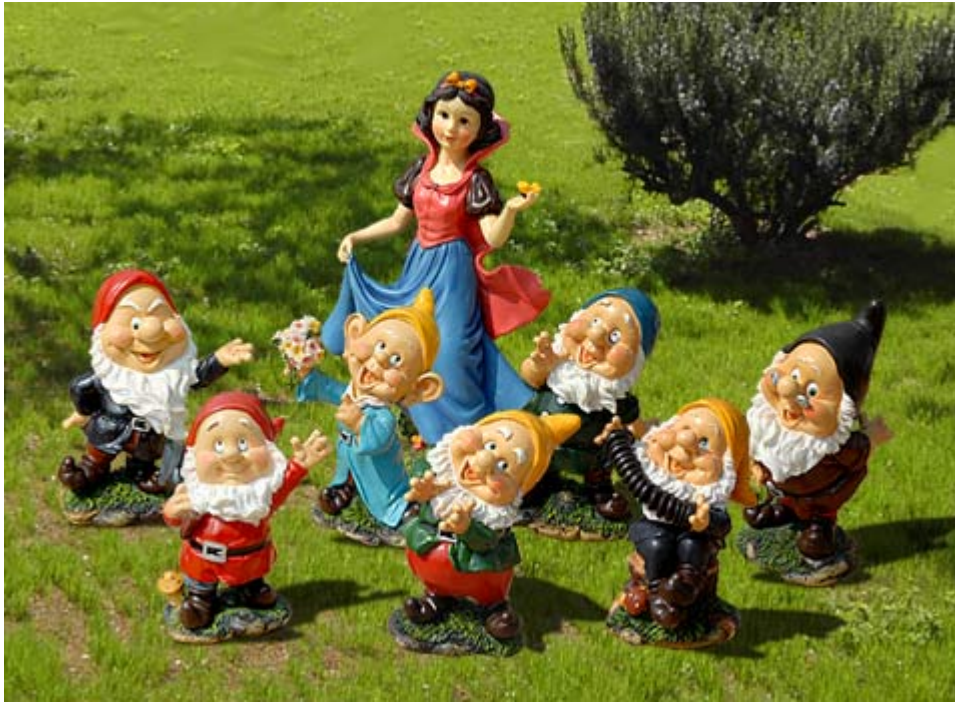
Slika 1: Vrtni patuljci.