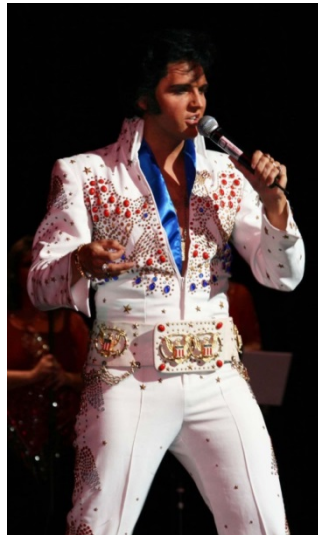
Slika 23: Elvis Presley u Las Vegas fazi.

https://en.wikipedia.org/wiki/Village_People#/media/File:VillagePeople1978.jpg (24. svibnja 2017.)