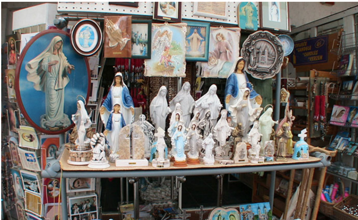
Slika 11: Suvenimica u Međugorju.

Ako je kič nadomjestak za umjetnost slijedi li iz toga da je nadomjestak i za istinsku duhovnost? Kao i svakoj drugoj umjetnosti i duhovnoj je potreban dar izvorne vizije koja opaža ljepotu ali se, nažalost, ona sve se češće svodi na pružanje površne i kičene laži, odnosno na religijski kič. Takav se kič locira prije svega u mjestima velikih vjerskih hodočašća, ali je prisutan i svuda gdje vjerske institucije nastoje prodrijeti u svakodnevicu, tj. osvojiti dio teritorija i vremena carstva profanog i moglo bi ga se podijeliti u tri kategorije. (Rabar 2002). Prva, najmanja grupacija, je blagi, umjereni kič kojem je najčešća inspiracija akademska umjetnost devetnaestog stoljeća. U drugu grupu spada napadni, diletantski kič u kojem se vidi utjecaj spomenutog akademizma ali na primitivan, vulgaran i, često, diletantski način. Treća grupa je nažalost najveća i tu pripada krajnje agresivan, kričav i sladunjav kič koji cilja na najviše razine, a pada u najniže i koji bi jeftinim i lažnim sredstvima htio dočarati ekstatično, rajsko stanje i mističnu viziju. (vidi sliku 11)