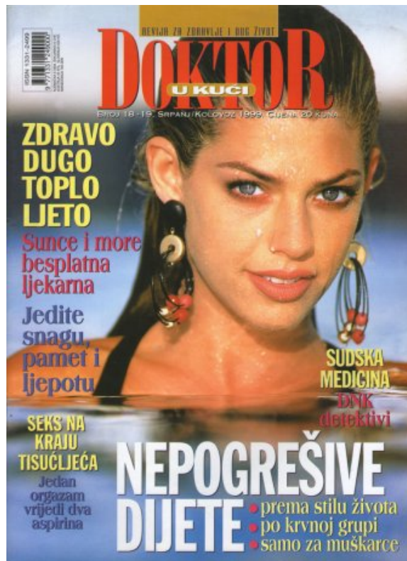
Slika 6: Naslovnica časopisa Doktor u kući.

Sve to dovodi do društva u kojem teško može doći do progresa. Za sada je val kičizacije tiskovina zaobišao jedino stručne časopise ali opće-tematska, informativna i zabavna štampa je itekako podložna utjecaju... teško je naći novine na kiosku koje nas neće savjetovati kako da spremno dočekamo ljeto, budemo u top formi, otvoriti nam oči o svemu što javne ličnosti rade iza naših leđa... (vidi sliku 6)