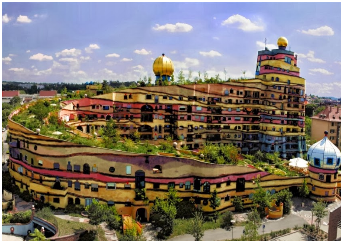
Slika 8: Kompleks zgrada Waldspirale (Šumska spirala) u njemačkom gradu Darmstadtu koji je projektirao bečki arhitekt Friedensreich Hundertwasser.

„manje je dosadno“ čime je naznačen povratak boja, raznolikosti, hibridne estetike i korištenja više stilova istovremeno ( vidi sliku 8 ). 12