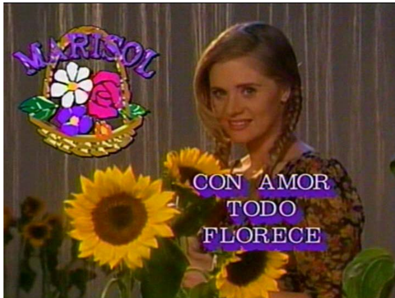
Slika 7: Najava za meksičku sapunicu Marisol.