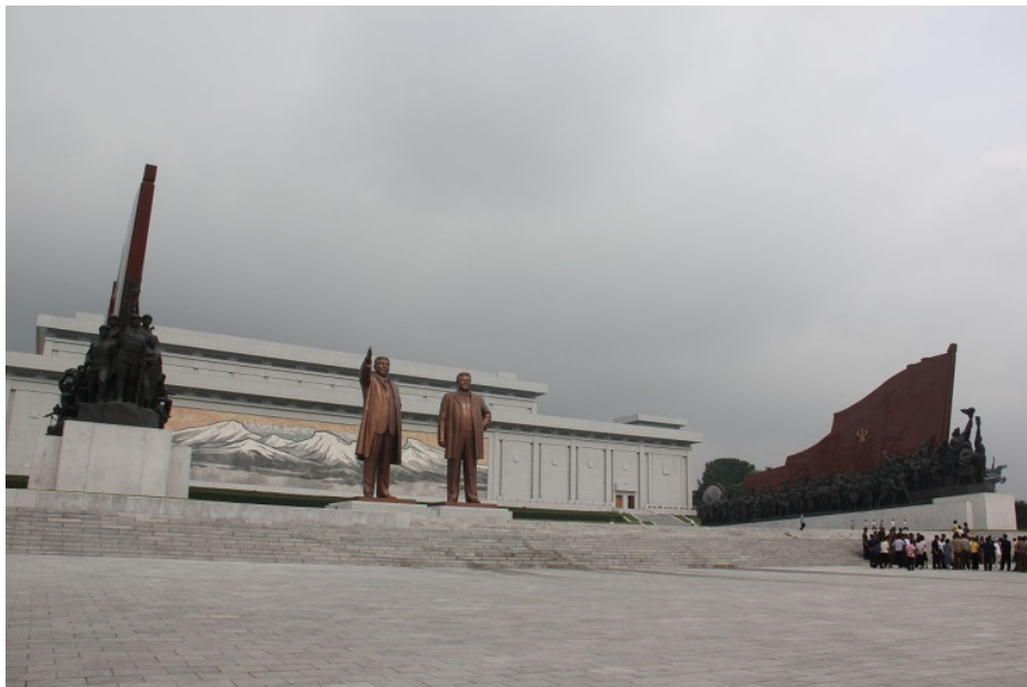
Slika 16: Veliki spomenik na brdu Mansu u krupnom planu s prikazom sva četiri spomenika koji ga sačinjavaju.

Komunizam/socijalizam bio je poznat po svojem soc-realističnom i jednoličnom urbanizmu, spomeničkom pretrpanošću ( vidi sliku 16 ) (gdje se ne smiju zaboraviti sve poze „oca nacije“) a umjetnička se ostvarenja mjere prema načinu uklapanja u referencijalni okvir ideološke istine i svi putovi vode prema centru (grada koji naravno nosi naziv vrhovnog tvorca, prvog od jednakih, stvarnih ljudi).