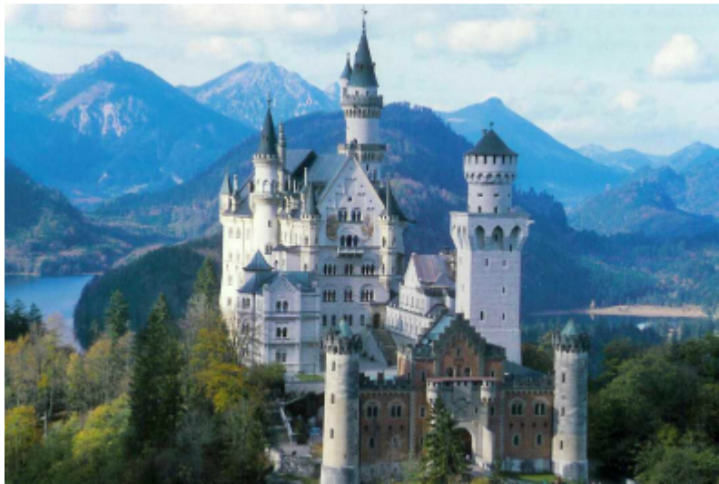
Slika 2: Dvorac Neuschwanstein

Što je zajedničko Ludvigu II. ( vidi sliku 2 ) i Waltu Disneyu ( vidi sliku 3 )? Što spaja lik Mona Lise i vrtnog patuljka? Zašto je danas Madonna slavija od Madone? Zašto volimo kič? I kako je on nastao? Odjednom ili je oduvijek svojstven čovjeku? Nalazi li se u oku promatrača ili postoje objektivni kriteriji prosudbe? Je li upravo kič izraz duha našeg vremena? 4