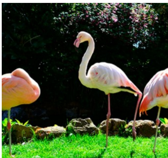
Slika 20: Plastični ružičasti flamingosi.

Kako se uobičajilo prisutnost campa obično se spominje u kazalištu, filmu i televiziji jer je on sam po sebi teatralna pojava što je sasvim u skladu s tim medijima. Međutim, camp se može pronaći u većini umjetnosti - pjesništvu, lijepoj književnosti, drami, a kako je prošlo već više od stoljeća od prve njegove pojave danas ga susrećemo i u mnogim društvenim domenama. Tako ako govorimo o campu u sportu govorimo o kuglanju, badmintonu i pikadu. Ako govorimo o modi onda govorimo o afro frizurama, odjeći popularnoj u 70-ima i košuljama za kuglanje iz 50-ih. Kao preklapanje ali i proširenje kiča govorimo o plastičnim ružičastim flamingosima, žutim suncokretima i keramičkim jelenima na travnjaku kao i registarskim pločicama s imenima parova koji posjeduju auto i slično. ( vidi sliku 20 )