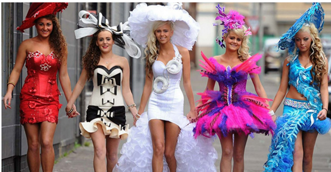
Slika 10: Kič u modi.

Svakodnevni život danas ne možemo zamisliti bez mode. Ona je u njegovom središtu ali problem s njom je što je često preplavljena kičem, pomodarstvom i usklađivanjem na tipičan kič način. Kič u modi najbolje se vidi kroz blještavilo, glamur, upornost pri potrebi da se izgleda seksi, neadekvatne kombinacije, što sve pokušava, i može biti, dopadljivo, ali krajnji se rezultat može opisati kao nešto nametljivo i jeftino. (vidi sliku 10) Kako je kič-čovjeku i/ili malograđaninu važna vanjska forma, ta mu površnost odgovara, a kako je moda uvijek vezana za moć tako se putem nje osjećaju manje inferiorni.