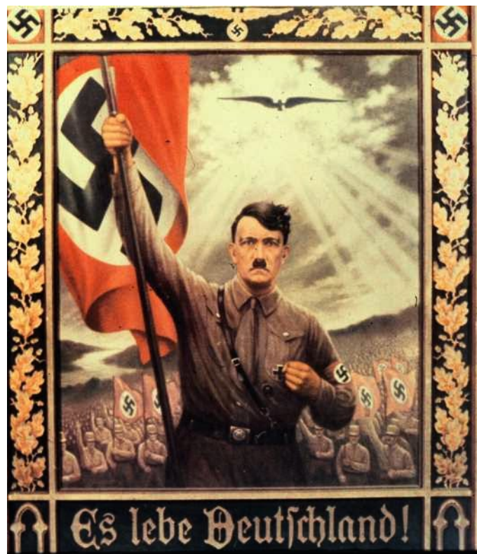
Slika 14: Naci kič.

pristalica kiča, netko tko je „živio „krvavi kič“ a volio jako zaslađeni (Broch 1997) i iako ga se u to vrijeme smatralo pobornikom ljepote on je zapravo bio pobornik kiča (kako i njegov povijesni uzor Neron) a stvaranjem vlastitog kulta ličnosti instalirao se kao kreativni direktor mnogih megalomanskih ideja. Poput tipičnog kič čovjeka i Hitler je umjetnička djela (Wagner) kao i radove filozofa (Schopenhauer i Nietzsche) doživljavao selektivno i njegov se ideološki koncept temeljio na ideji germanskog nadčovjeka koji vuče porijeklo iz daleke mitske prošlosti i koji će sagraditi novo svjetsko carstvo u kojem će biti mjesta samo za prave arijevence a inferiorne rase će im služiti ili biti istrjebjenje. Znamo kako je završio taj koncept i kako se Hitler suočio sa sumrakom vlastitih bogova - njegove monstrozne kičaste vizije utemeljene na mitizaciji sebe i svog naroda razorene su s ostatkom Njemačke. ( vidi sliku 14 )