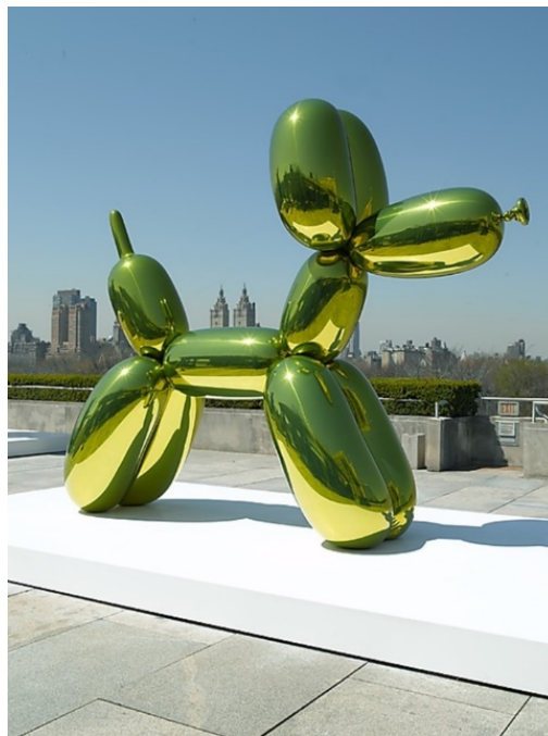
Slika 5: Balloon Dog (Yellow) Jeffa Koonsa

Ako uzmemo za primjer Jeffa Koonsa čija su djela vrhunac kiča, ali su toliko poznata da su prešla na drugu stranu – u umjetnost. Kako? Tako da je dobio potvrdu vrijednosti svojih djela od strane struke (inače bi i dalje kotirao kao „kič-čudaković“). Dakle, nakon potvrde njegova djela, ona, iako očiti kič, više nisu kič jer se prodaju za milijunske iznose... odnosno, jedini zaključak koji se može izvesti iz ovog primjera jest ako i je kič, više nije, jer je skupo. (vidi sliku 5)