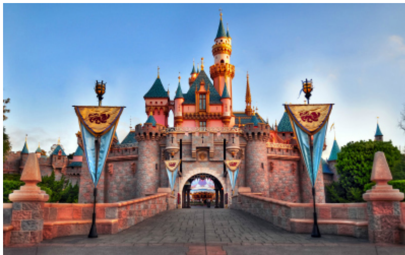
Slika 3: Snjeguljičin dvorac Walta Disneya.