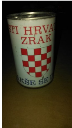
Slika 19: Konzerva Čisti hrvatski zrak, lakše se diše.