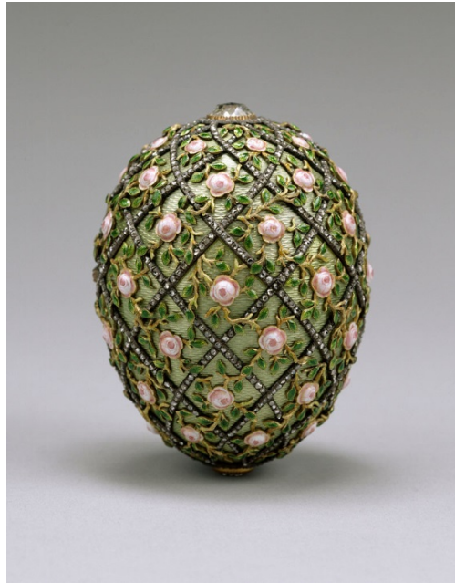
Slika 4 : Fabergeovo jaje.

definiranje i određivanje ukusa, ali postoje pokazatelji i promjene u ukusu koje nam pokazuju kako se ukus i vrednovanje umjetnosti mijenja ovisno o povijesnim prilikama. Djela lošeg ukusa iz prošlih vremena nisu nužno kič samo zato što nam nisu bliska po duhu i njegovo se utvrđivanje razlikuje od utvrđivanja autentičnog kiča postmoderne (Dorfles 1997). Danas su mnogi elementi tog lošeg ukusa postali dijelom umjetničkih djela i umjetnosti što distinkciju između kategorija umjetnosti i onoga što to nije čini problematičnom a često i nemogućom.