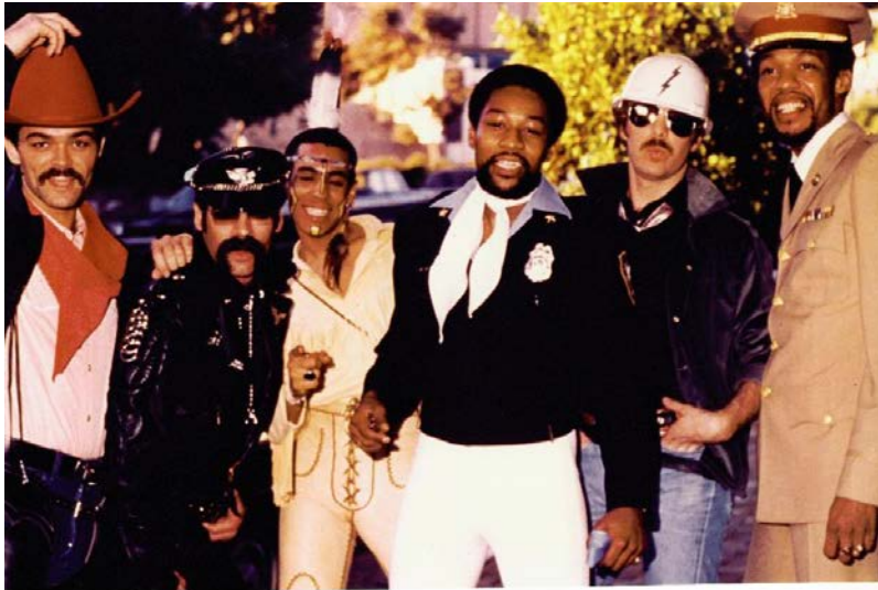
Slika 22: The Village People.