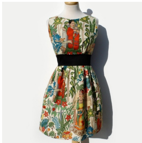
Slika 9: Haljina inspirirana motivima meksičke slikarice Fride Kahlo.

Ako u okviru arhitekture govorimo o kiču i stanovanju onda moramo reći da se u tom segmentu kič često može vidjeti u luksuznoj beskorisnosti pojedinih predmeta u čemu se ogleda midcult ukus koji želi pokazati svoje želju za moći koja se očituje u tehnici a koja nije samo nepraktična nego i nema nikakvo značenje. Tu je mnogo predmeta koji su i zamišljeni i napravljeni kao kič (Mondrianove slike koje se koriste kao presvlake za kauč ili motivi Fride Kahlo na odjeći) ( vidi sliku 9 ) i sve dok dizajneri i proizvođači na te predmete budu gledali kao na reklamu a ne projektiranje i dizajniranje, oni će ostati ljuštura koja pokušava stvoriti sliku statusnog simbola a koja je uslijed ubrzanog zastarijevanja svega oko nas predodređena da postane tipični kič. Kako zadržati smisao nekog predmeta ako ga se izjednačava sa željom za uspjehom u društvu što samu njegovu bit čini smiješnom i uzaludnom?