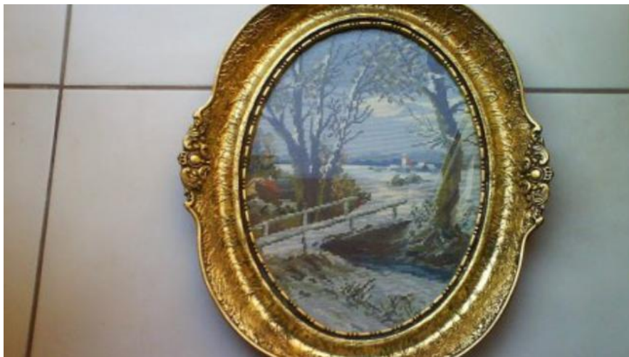
Slika 18: Goblen.

Manje-više svi radovi, publikacije, razgovori koji se bave problemom lošeg ukusa zadržavaju se na tradicionalnom kiču, koji je vjerojatno najbenigniji od svih do sada spomenutih i koji uključuje već spomenute vrte patuljke, porculanske figurice, goblene i slično. (vidi sliku 18)