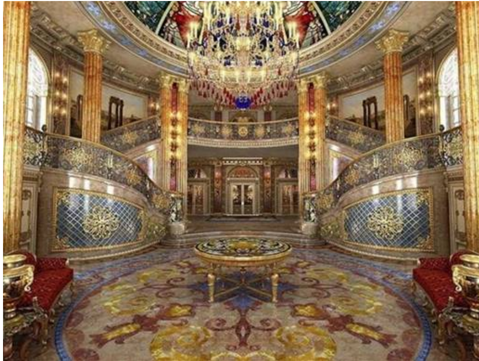
Slika 30: Rezidencija Viktora Janukoviča.

„velike nacije“ dok prvi ginu na ratištu također. Ruski političar Vladimir Žirinovski je prava camp figura sa svim njegovim bizarnostima, pretjeranošću, ekscesima, opscenostima... i sve to govori i izvodi smrtno ozbiljan gdje je ta ozbiljnost ono što od same pretjeranosti čini camp . Kuća Viktora Janukoviča ( vidi sliku 30 ) sa zlatom po zidovima, secesijskim i bidermajer namještajem, kabaretskim bijelo lakiranim klavirom, Fabergeovim jajima više liči na kuću u kojoj bi živio Liberace nego ozbiljni i konzervativni predsjednik države.