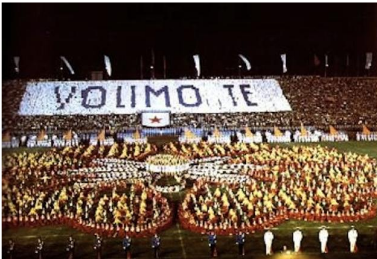
Slika 17: Dan mladosti.