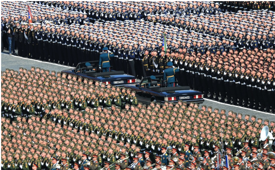
Slika 15: Vojna parada u Rusiji.

Veliku ulogu u afirmiranju socijalističkog društvenog poretka imao je golemi propagandni aparat, a kako je korištenje kiča najefikasniji način da se totalitarni režim dodvori svjetini, tako ni sovjetski vođe nisu prezali od spektakularnih vojnih parada i novokomponiranih obreda. ( vidi sliku 15 )