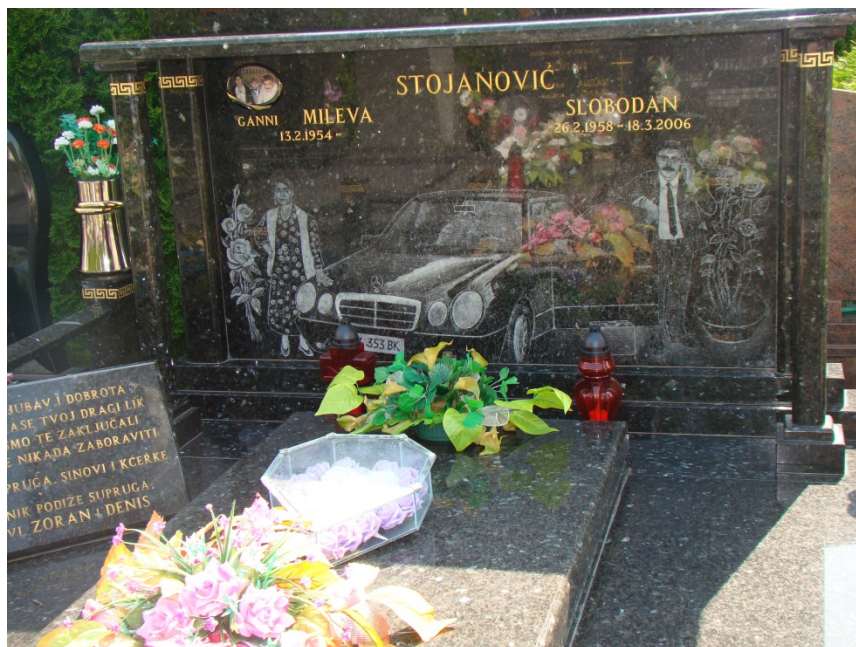
Slika 12: Nadgrobni spomenik (26. svibnja 2017.)

O smrti kao saveznici kiča moglo bi se napisati posebno poglavlje. Danas su grobnice prepune simbola koji su nešto kao posljednji iskaz štovanja uspomene na pokojnika, samo izražen lošim ukusom... a možda je prodor lošeg ukusa na područje smrti započeo upravo s gubitkom poštovanja prema istoj. ( vidi sliku 12 )