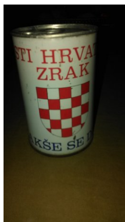
Slika 19: Konzerva Čisti hrvatski zrak, lakše se diše.