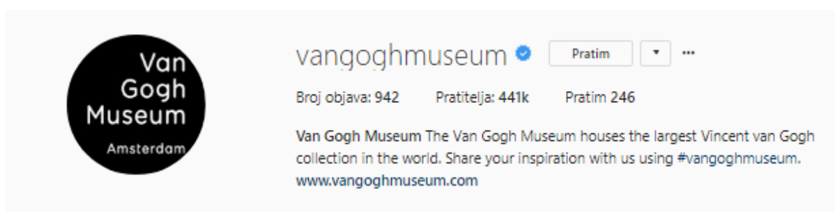
Slika 1. – Primjer opisa koji ispunjava gore navedene karakteristike

Bilo da je riječ o Facebooku, Instagramu ili Twitteru, brendovi često ne obraćaju dovoljno pažnje opisu profila. Kada je institucija u procesu izgradnje brenda, treba jasno dati do znanja kojom djelatnosti se bavi i što pratitelj može očekivati od profila (slika br.1). Idealno bi bilo ubaciti i poziv na akciju u opis, poput hashtaga. Na opis treba gledati kao na “pitch” - zašto bi potencijalni pratitelj i posjetitelji zapratili upravo taj brend. (Jackson 2016)