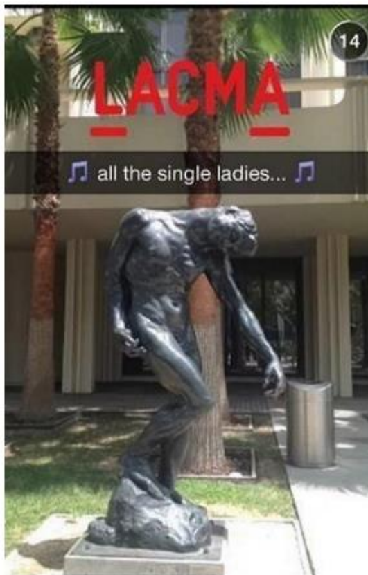
Slika 7. – LACMA Snapchat kampanja