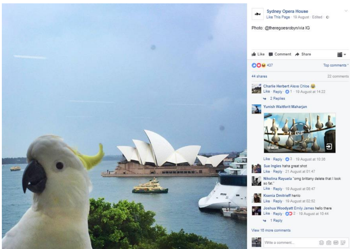
Slika 3. – Fotografija korisnika podijeljena na službenoj Facebook stranici institucije izazvala je oduševljene reakcije među pratiteljima

koju imaju kako bi vidjeli što se dogodilo jučer, što je “trend” u tom trenutku i kakvi se razgovori odvijaju. Nakon toga razgovara sa svojim timom što su napravili taj dan i kakve povratne informacije primaju od pratitelja. Postoji li možda nešto što bi moglo poslužiti operacijskom timu? Postoji li možda povratna informacija koja bi bila važna timu za organizaciju? Postoji li koji kvalitetan prijedlog koji mogu uvrstiti u šou? Postavlja li tko pitanje kojeg se nisu dotaknuli? Trebaju li pripremiti objavu vezano za određenu informaciju? Naglašava da prilikom objavljivanja sadržaja koriste geolokacijski alat. Uz to, ako je netko na mjestu događanja i nešto objavi te označi profil Sydney Opera House ili stavi njihovu lokaciju (slika br. 3), tim će vidjeti fotografiju i često ju podijeliti s javnošću. To je nešto što trude poticati jer vide vrijednost u tim iskrenim reakcijama. Način na koji to potiču je upravo putem digitalnih ekrana. Na primjer, osmislili su hashtag za Festival opasnih ideja - #fodi. I tijekom FODI festivala, imali su ogromne ekrane posvuda koji u stvarnom vremenu prikazuju što ljudi misle. Poticali bi rasprave i vodili interakciju s njima. Tim putem Sydney Opera House za društvene medije razvija osjećaj nacionalnog identiteta. (Hutchinson 2017)