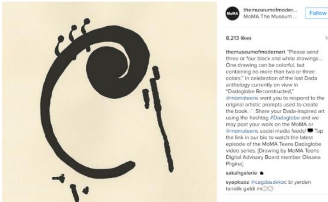
Slika 2. – Uključivanje korisnika u stvaranje sadržaja pod zajedničkim hashtagom