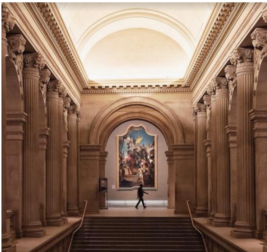
Slika 6. – #EmptyMet Instagram kampanja