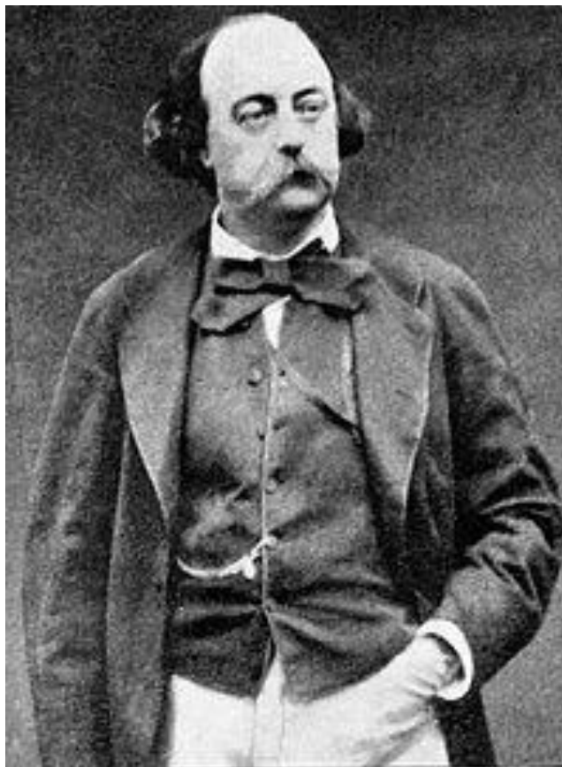
Slika br. 1 „Gustave Flaubert“

Gustave Flaubert rođen je u Francuskoj, 12. prosinca 1821. godine u Rouenu, gradu koji spominje i u djelu Gospođa Bovary . Pisanjem se bavio od djetinjstva. Pokušao je studirati pravo u Parizu po nagovoru roditelja, ali kako mu se grad nije svidio napustio je studij. Preselio se tada na obiteljski posjed u Croissetu i tamo ostao do svoje smrti, no u pronađenim podacima stoji kako je često putovao; (Pirineji, Trouville, Normandija, Bliski istok, Malta, Kairo, Tunis itd.). Detalji su bili vidljivi u njegovim spisima koje je pisao tijekom putovanja. Zanimljivo, a vezano za ovo djelo jest činjenica da mu je otac bio liječnik, a majka kći liječnika, što je također projicirao na likove i neke događaje vezane uz Charlesove pokušaje napretka. Gustave Flaubert svoje je djetinjstvo proveo u bolnici pa mu je to svakako omogućilo da zorno prikaže neke događaje. Njegovo prvo djelo bilo je Iskušenje sv. Antuna – pjesničko filozofska rapsodija. U opusu njegovih djela nalaze se još: Sentimentalni odgoj , Salambo , Tri priče te Bouvard i Pécuchet ; roman koji je objavljen posthumno. Flaubert je umro na obiteljskom posjedu u Croissetu, 8. svibnja 1880. godine.