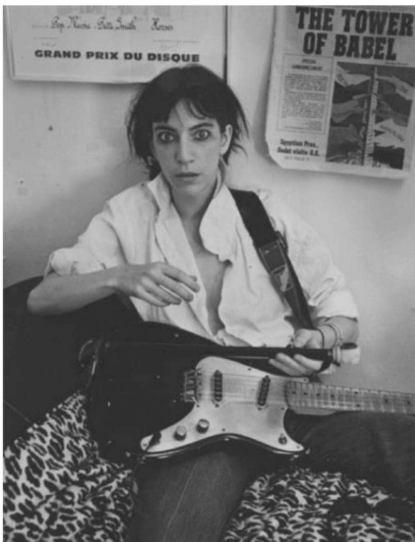
Slika br. 11 „Patti Smith“

“Prvih godina u New Yorku mladi se par družio s beatnicima i prisustvovao mnogim čitanjima poezije za koja je Patti izjavila kako su često bila naprosto dosadna, te je ona, i sama pjesnikinja, odlučila kako će njezino prvo javno čitanje biti nešto posve drugačije. Tako je i bilo.” 50