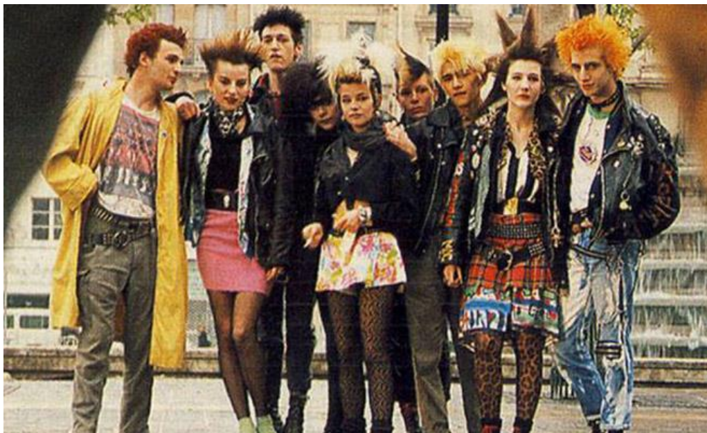
Slika br. 10 „Odjeća kao prikaz pripadnosti subkulturi punkera“

“Sve što je sedamdesetih godina moglo okupiti mlade i nekamo ih usmjeriti bilo je loše. Iako je laburistička vlada zbog postojanja punk-rocka doživljavala neugodnosti, još je neugodnije bilo stvarnim centrima moći, pa je stoga bilo lakše opravdati praktički sva sredstva, samo da se zemlja nekako riješi ‘Narodne stranke’. Naposljetku, ‘prijetnja’ koju je simbolizirao punk pojavila se za laburističke vlasti.” 47