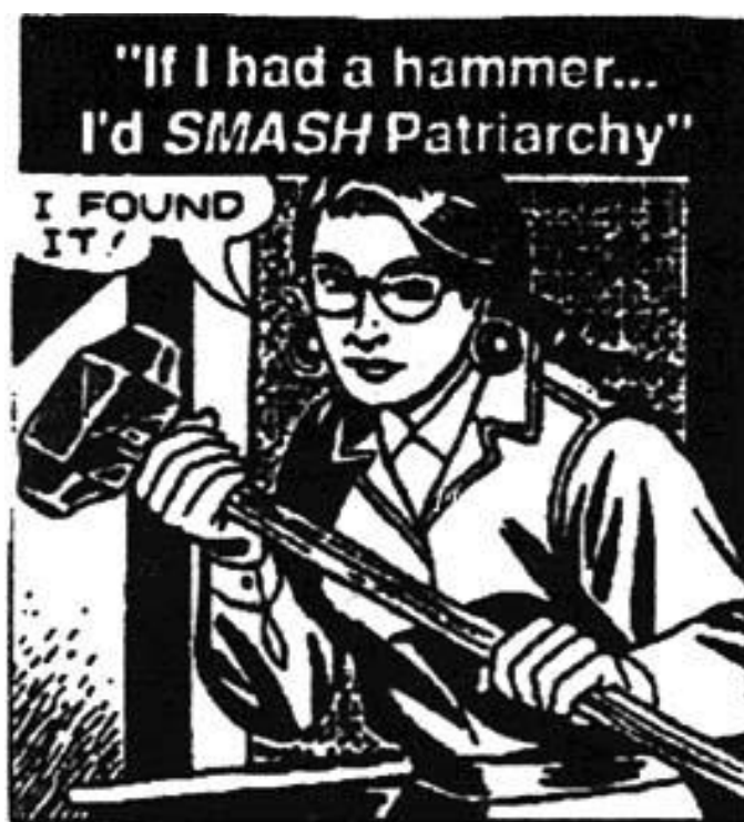
Slika br. 2 „Patrijarhat na izdisaju“

„Patrijarhat je bio kulturološki i društveni trijumf. Priznanje očinstva protumačeno je kao potvrda razuma, kao napredak koji je preduvjet i temelj nastanku civilizacije, koja je u potpunosti djelo muškarca.“ 16