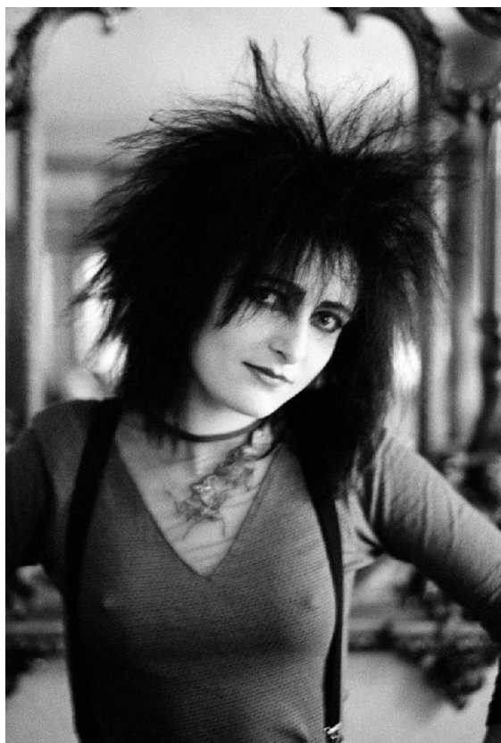
Slika br. 11 „Siouxsie Sioux”

„Radi se o ženskim punk bendovima poput The Slits ili bendovima s frontmenicama poput Siouxsie Sioux, u kojima žene nisu pokazivale ranjivost i nisu igrale uloge zavodnica i fatalnih žena, a unatoč tome, moć su izražavale svojom seksualnošću, ali i inteligencijom i bijesom.” 48