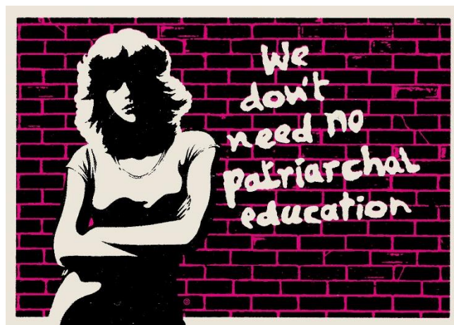
Slika br. 3 „Ne trebamo patrijarhalnu edukaciju!“

„Najvažniji trenutak prodora feminizma u kulturalne studije bio je zbornik Žene ulaze u raspravu. Aspekti ženske podređenosti , tiskan 1978. kao rezultat rada Grupe za ženske studije.“ 18