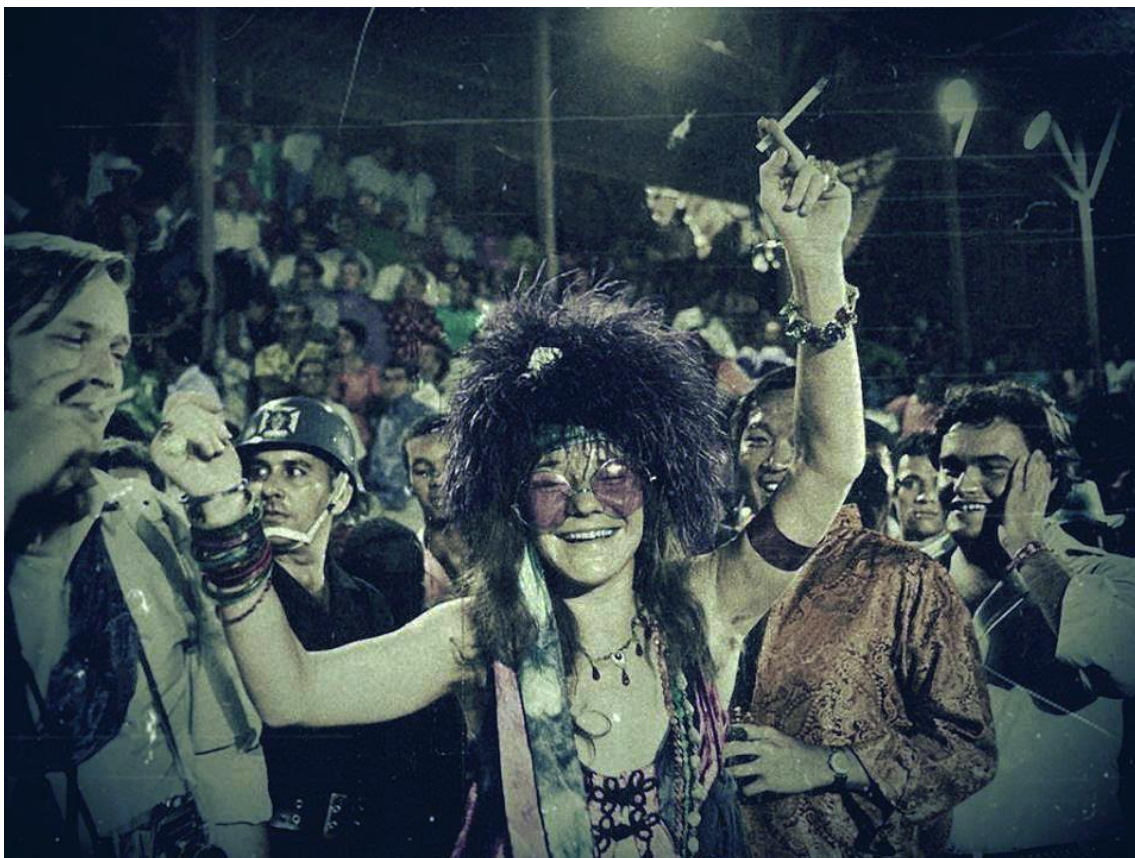
Slika br. 8 „Janis Joplin, 1970.“

Janis je umrla 4. listopada 1970. godine u Los Angelesu, u dvadeset i sedmoj godini života. Od tada je prošlo četrdeset i osam godina, ali interes za njezin život i doba u kojem je živjela ne jenjava. Zbog njezinog bunta i odbacivanja svih okova konvencionalnosti uvijek će ostati prepoznata kao istinska legenda blues rocka.