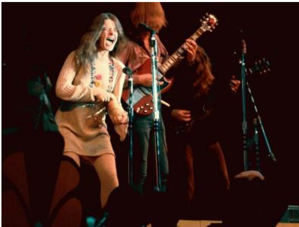
Slika br. 7 „Janis Joplin na Monterey Pop festivalu“

Nedugo nakon povratka u San Francisco, postala je članica grupe Big Brother. U tom razdoblju Janis se mijenja kako se mijenjalo i vrijeme i klima društva u kojem se nalazila. Razvila je osjećaj za modu i prilagođavala svoj glas kako bi odgovarao rock publici. Jedan od važnijih događaja za Janisinu karijeru bio je Monterey Pop Festival koji se održao 1967. godine.