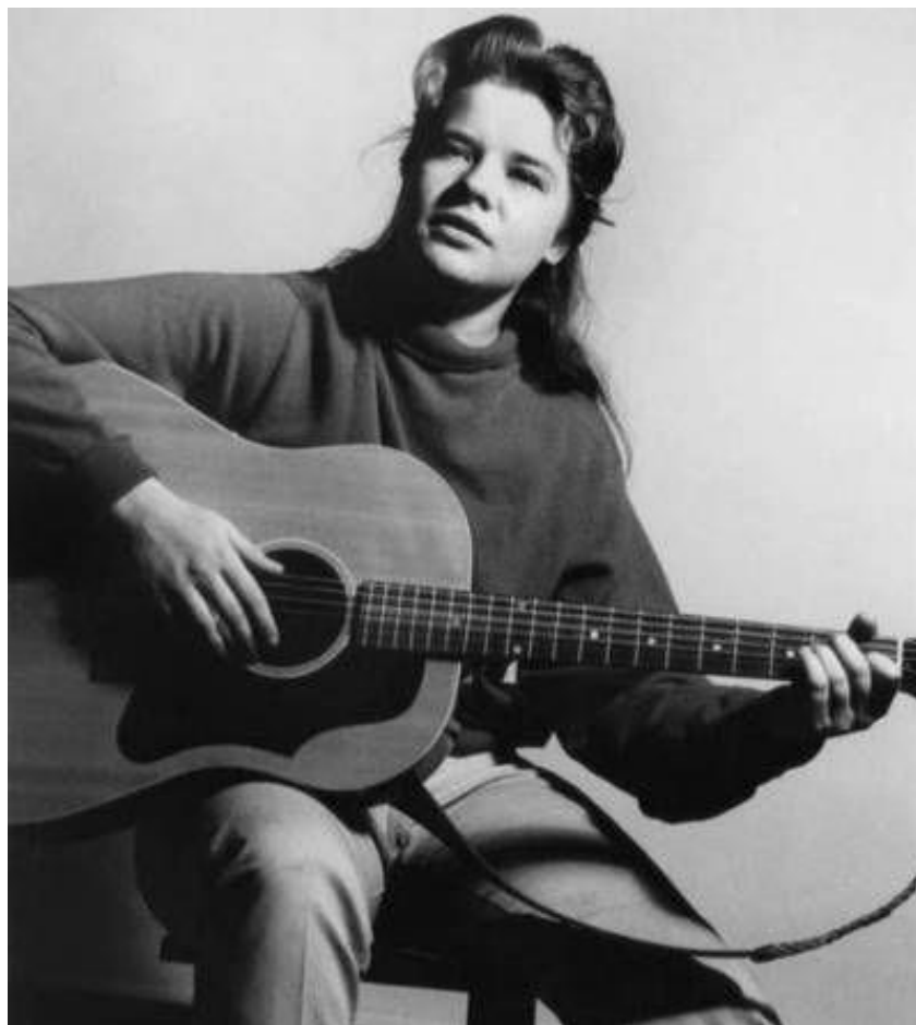
Slika br. 4 „Janis Joplin, 1962.“