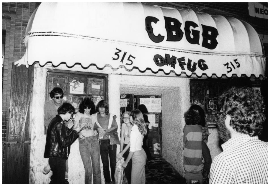
Slika br. 9 „Ramonesi ispred CBGB kluba“

Ovaj put u New Yorku, pojavilo se nešto novo u klubu CBGB koji će ostati prepoznatljiv kao mjesto gdje se rodio punk.