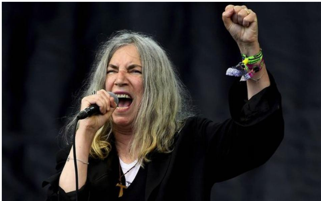
Slika br. 12 „Patti Smith u Ateni 2016.“

Patti Smith i danas korača glazbenom scenom u dobi od 71. godine te svojim intervjuima i glazbom inspirira mlade ljude izjavama o ljepoti života koji se mora znati dobro iskoristiti.