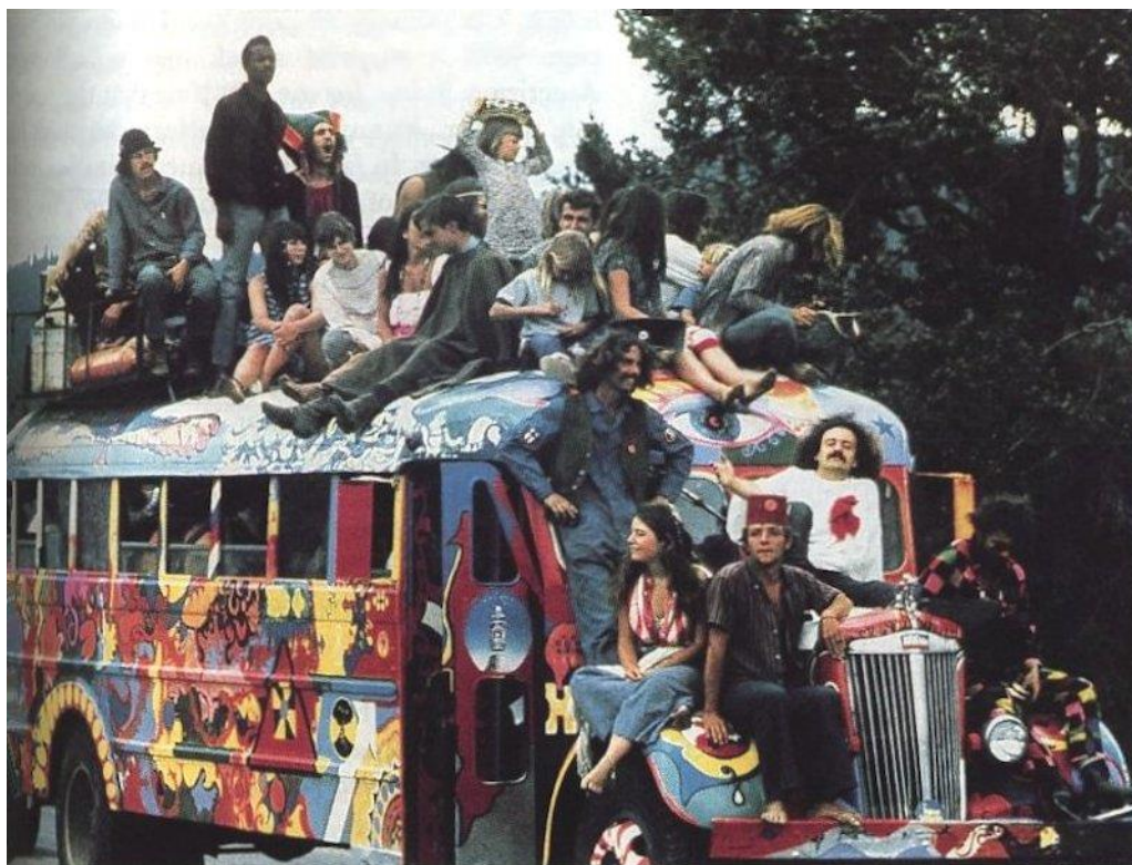
Slika br. 6 „Pripadnici hippie pokreta“

„Glazba je također postala strast za Janis i njene buntovne prijatelje. Glazba nije bila samo buka u pozadini; bila je objava različitosti. Slušajući kasno noćne radijske emisije ili kopajući po policama lokalne prodavaonice ploča, istraživali su glazbu kakvu nikad prije nisu čuli – posebno folk, jazz i blues. Za njih je to bila buntovnička glazba, neiskvarena komercijalizacijom.“ 37