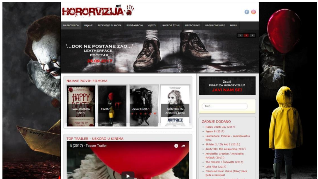
Slika 16: Prikaz sučelja web-stranice hororvizija.net.

HorrorHR nije jedina web-stranica koja se bavi tematikom horor filma. 2012. godine pojavila se web-stranica pod nazivom Hororvizija . Autor i administrator stranice je Josip Brkić, a stranica je također nastala iz prvotne forme bloga, iz razloga što su uređivačke mogućnosti na platformama za web dizajn bile i ostale veće. Stranica se isključivo bavi horor žanrom i to recenzijama horor filmova, ali i zanimljivostima koje imaju veze sa žanrom.