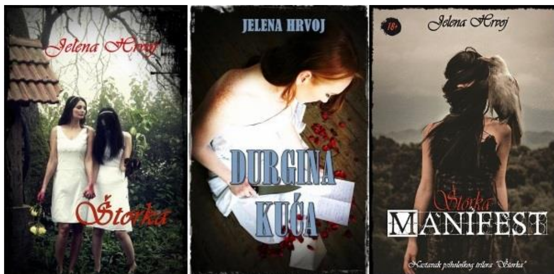
Slika 1: Naslovnice romana 'Štorca' (2014.), 'Durgina kuća' (2016.) i 'Štorca Manifest' (2017.) autorice Jelene Hrvoj

Štorke krene u ubilački pohod pedofila, silovatelja i ubojica, gdje i sama postane dio posljednje navedenih. Radnja je opisana u dva vremenska perioda, a široka karakterizacija likova te konceptualnost sadržaja omogućili su nastavak priče pod nazivom Štorca Manifest , romana objavljenog 2017. godine (Hrvoj, 2014.).