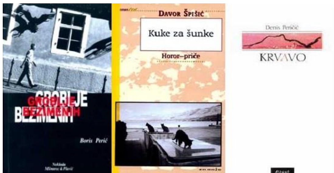
Slika 5: Naslovnice zbirke priča 'Groblje bezimernih' (2003.), 'Kuke za šunke' (2004.) i 'Krvavo' (2004.)

Rosamund, Sestre sepije, Cornflakes, Da ti gatam, Baranja Inn te Osveta Mojmira Bunjače (Špišić, 2001.).