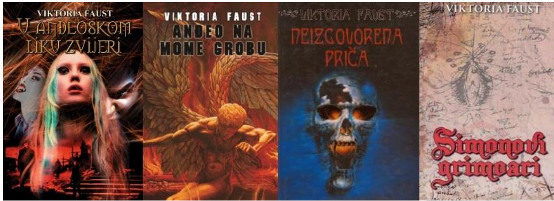
Slika 2: Naslovnice romana Viktorije Faust - 'U anđeoskom liku zvijeri' (2000.), 'Anđeo na mome grobu' (2003.), 'Neizgovorena priča' (2005.) i 'Simonovi grimoari' (2016.)