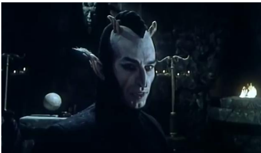
Slika 6: Prikaz sotone u filmu 'Čovjek koga treba ubiti' (1979.) red. Veljko Bulajić

Tijekom 1979. godine pojavio se film crnogorsko-hrvatske produkcije u režiji Veljka Bulajića pod nazivom Čovjek koga treba ubiti . Povijesno-fantastični film koji izlazi iz gabarita dotadašnje jugoslavenske kinematografije, Čovjek koga treba ubiti opisuje legendu o samoprozvanom crnogorskom caru Šćepanu Malom neznanog porijekla, koji je vladao Crnom Gorom u drugoj polovici osamnaestog stoljeća, preciznije od 1767. do 1773. godine, predstavljajući se kao ruski car Petar III. Ukratko, nakon ubojstva pravog ruskog cara Petra III. po naredbi carice Katarine II., Sotona zaključuje kako iz svojih redova u paklu treba poslati svog izaslanika na Zemlju, kako bi se ponovno uspostavila ravnoteža između predstavnika pakla i raja na Zemlji. U liku Šćepana Malog, Sotona šalje paklenog učitelja Farfu, koji uvelike izgleda kao Petar III., da zavlada Crnom Gorom i povede narod protiv Turaka. Gledajući crnogorski narod kako teško živi i kako mu sve više postaje odan i vjeran, Šćepan Mali sve više odmiče od Sotone i njegovog plana te se priklanja smrtnicima, pritom se i zaljubivši, što Sotonu čini gnjevnim i odlučnim ukloniti svog nekadašnjeg izaslanika.