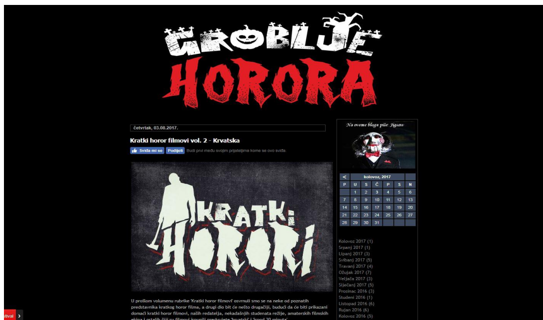
Slika 18: Prikaz sučelja bloga recenzijefilmova.blog.hr.