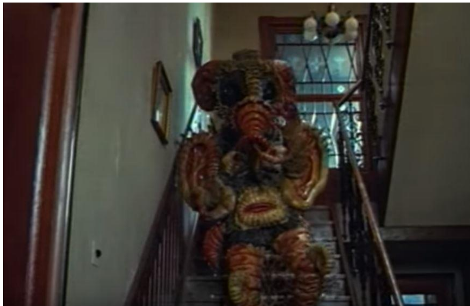
Slika 8: Izvanzemaljca Mumu u filmu 'Gosti iz galaksije' (1981.) red. Dušan Vukotić

Eksploatacijske scene dosad su najbrojnije u domaćem filmu, vjerojatno i do dan danas, gdje možemo vidjeti Mumua kako prisutnim gostima na večeri otkida glave, reže udove, ispušta smrtonosne plinove te po njima bljuje vatru. Možda najbolja referenca na trash filmove