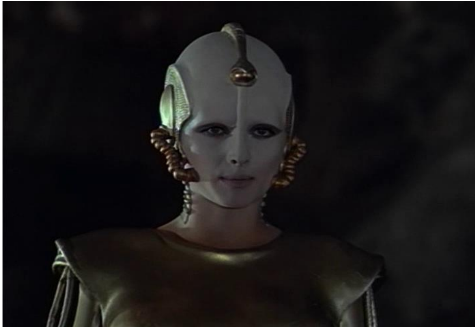
Slika 7: Izvanzemaljka Andra u filmu 'Gosti iz galaksije' (1981.) red. Dušan Vukotić

efekti na razini su tadašnjih svjetskih standarda znanstvenofantastičnih filmova, a kostimografija i scenografija kreativno su i kvalitetno napravljene. Na sljedećim slikama možemo vidjeti izgled spomenutih izvanzemaljaca: