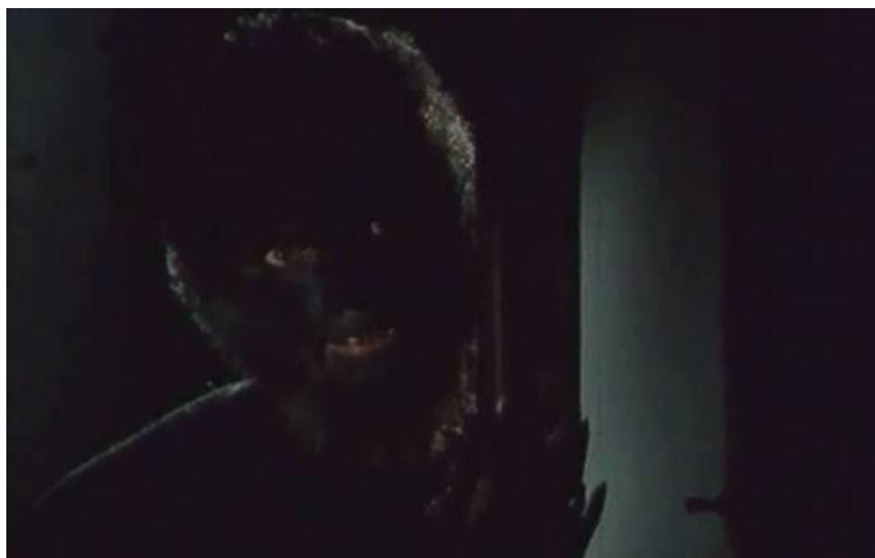
Slika 10: Prvi hrvatski filmski vukodlak - Mor u filmu 'Mor' (1992.) red. Snježana Tribuson

Za potrebe ovog rada, potrebno je spomenuti ovaj film utoliko što se bavi tematikom vukodlaka. Niti jedan drugi segment filma ne možemo dovesti u kontekst filma strave, niti cjelokupan proizvod možemo okarakterizirati horor filmom. Šminka i izgled vukodlaka mogu se referirati na crno-bijeli film The Wolf Man (Čovjek Vuk) iz 1941. godine, a njegova siromašna pojava, koju utjelovljuje Filip Šovagović, događa se u doslovno jednoj sceni, koja se može vidjeti na potonjoj slici.