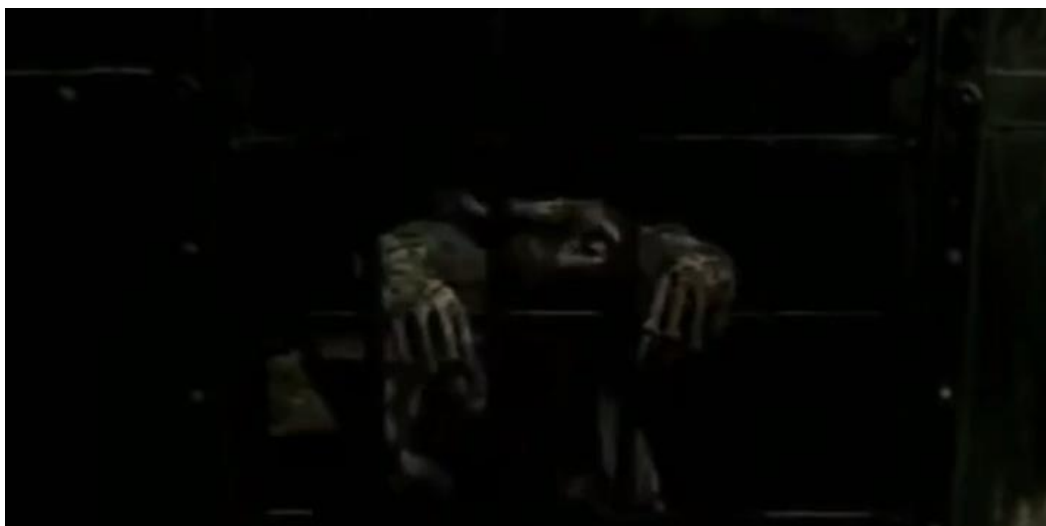
Slika 14: Veliki štakor u filmu 'Infekcija' (2003.) r. Krsto Papić

U filmu se nalazi prepoznatljiva glumačka postava, Leon Lučev u glavnoj ulozi pisca Ivana Gajskog, Sven Medvešek u ulozi profesora Boškovića, Lucija Šerbedžija u ulozi Sare, Filip Šovagović u ulozi gradonačelnika te pored navedenih – Božidar Alić, Ivo Gregurević, Zlatko Vitez, Vanja Drach i drugi. Film, iako je prvotno snimljen 2003., distribuirao se tek 2005. godine zbog rezanja i prilagođavanja određenih scena te je u kraćoj verziji prikazan u kinima.