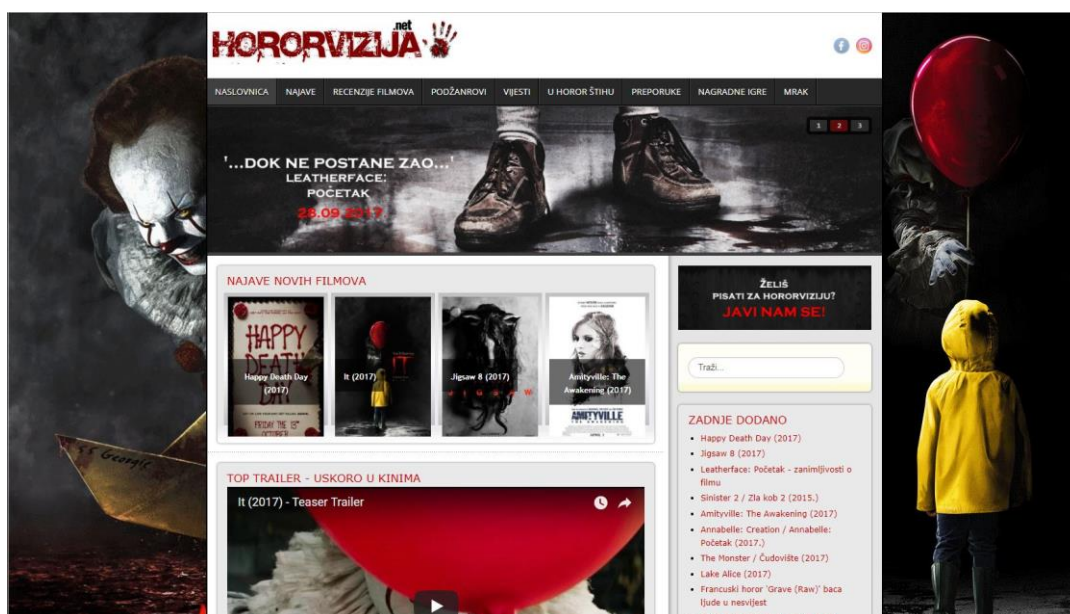
Slika 16: Prikaz sučelja web-stranice hororvizija.net.

HorrorHR nije jedina web-stranica koja se bavi tematikom horor filma. 2012. godine pojavila se web-stranica pod nazivom Hororvizija . Autor i administrator stranice je Josip Brkić, a stranica je također nastala iz prvotne forme bloga, iz razloga što su uređivačke mogućnosti na platformama za web dizajn bile i ostale veće. Stranica se isključivo bavi horor žanrom i to recenzijama horor filmova, ali i zanimljivostima koje imaju veze sa žanrom.