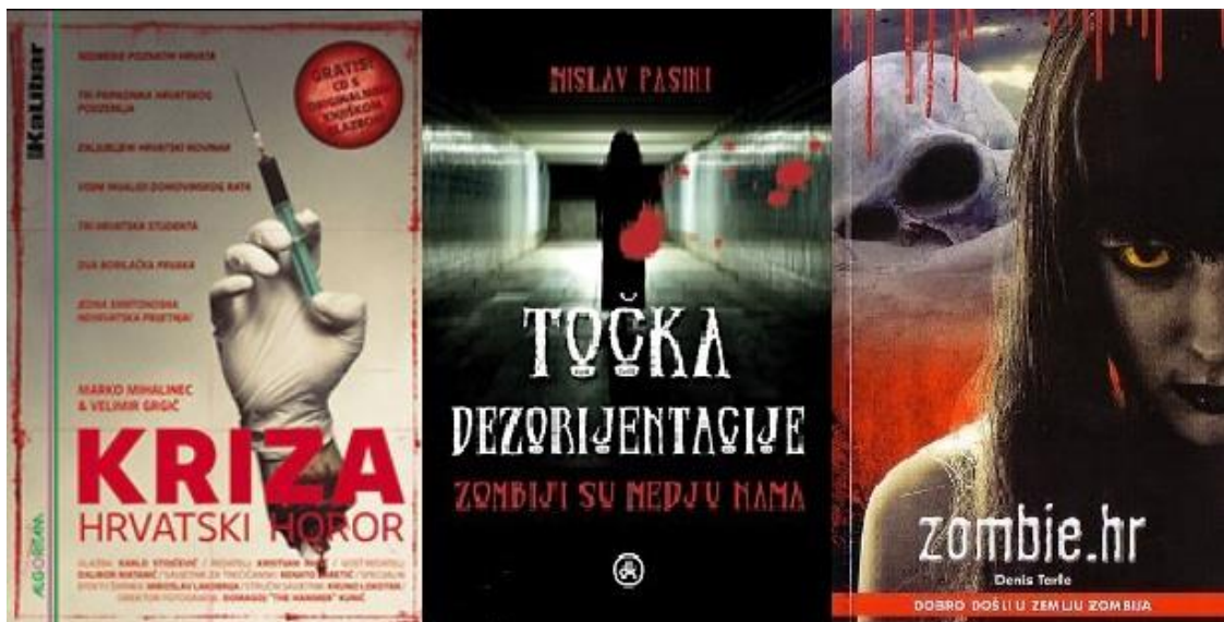
Slika 3: Naslovnice romana 'Krizi - hrvatski horor' (2010.), 'Točka dezorijentacije' (2010.) i 'Zombie.hr' (2013.)

Velimir Grgić i Marko Mihalinec koautori su romana s motivima filma Kriza - hrvatski horor , priče koja se bazira na pojavi zombija u hrvatskoj metropoli ispričanoj iz više situacija i uglova. Neidentificiran virus počinje se širiti ulicama Zagreba, prouzročivši masakr i pokolj među građanima, budući da svi zaraženi postaju željni ljudskog mesa. U radnju su, osim policije i vojske, uključeni ljudi s hrvatske estrade (Mišo Kovač, Jacques Houdek, Edo Maajka, Indira, Maja Šuput...), Hrvatski vojni invalidi Domovinskog rata, mafija, studentska populacija te pojedini likovi koji na različite načine doživljavaju kaotičnu situaciju. Ovaj crnohumorni horor roman specifičan je, osim po brojnim pop-kulturnim referencama, i po tome što je multimedijalan. Naime, uz samu priču autori u dodatcima pružaju i nacrtane skice likova, oružja, izgleda zombija i druge ilustracije, komentare redatelja Kristijana Milića i Dalibora Matanića, a također je komponirana i glazba snimljena na CD-u, namijenjena za radnju romana, za koju je zaslužan Karlo Stojčević (Mihalinec; Grgić, 2010.).