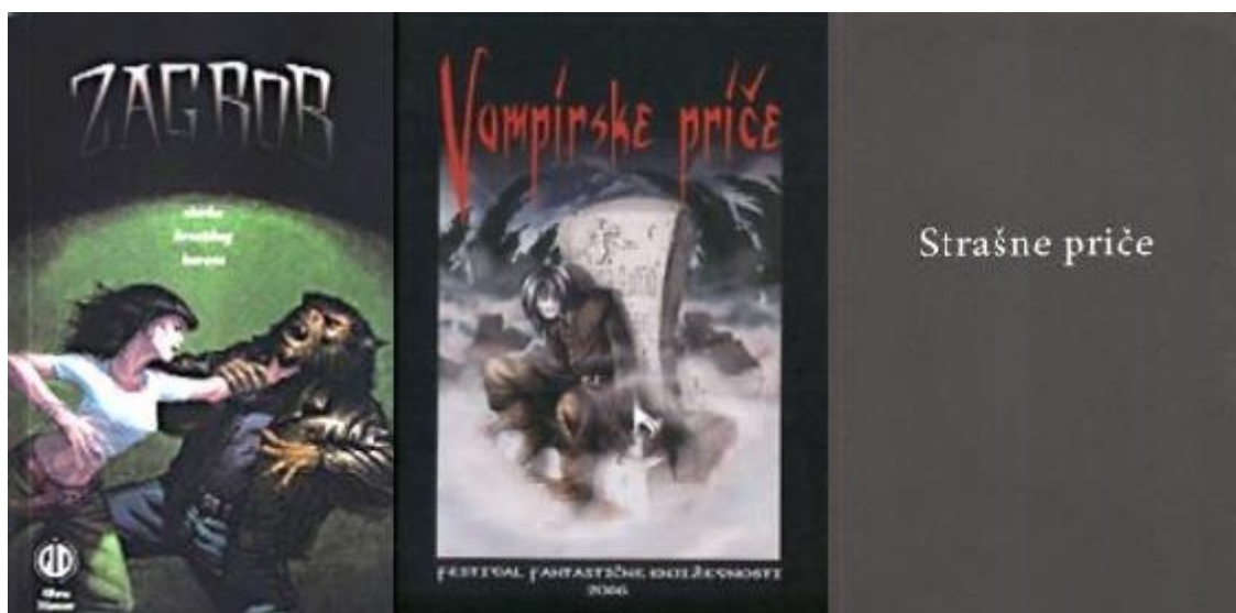
Slika 4: Naslovnice zbirki priča 'Zagrob' (2006.), 'Vampirske priče' (2006.) i 'Strašne priče' (2013.)

pijesak te Oto Oltvanji i njegov esej Posećen na papir . Priče su tematski različite i ne progovaraju nužno o vidljivom, materijaliziranom zlu koje u horor pričama izaziva najveći strah, već nalazimo i manifestaciju zla u unutarnjim previranjima nestabilnih likova, no isto tako nude nam se i standardni horor elementi i motivi, preko duhova, gotike i vampira, vukodlaka, vudu čarobiranja, narodnih legendi pa sve do horor poezije i teksta o pojmu straha i kako i zašto ga doživljavamo (Jambrišak; Vrban, 2006.).