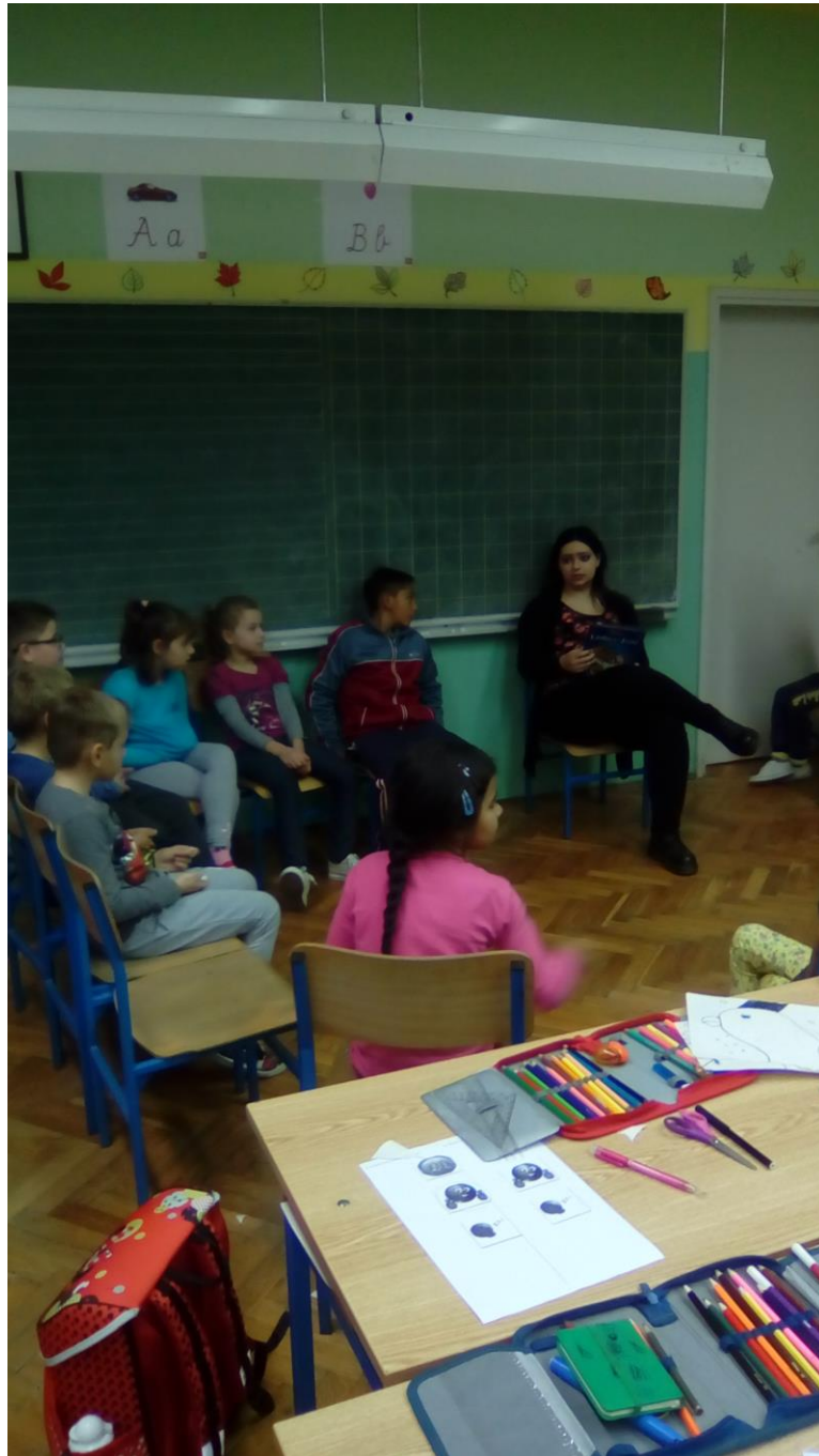
Sl. 1: Početak radionice