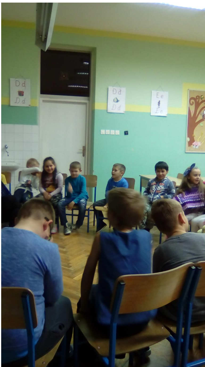
Sl. 3: Završni dio sata