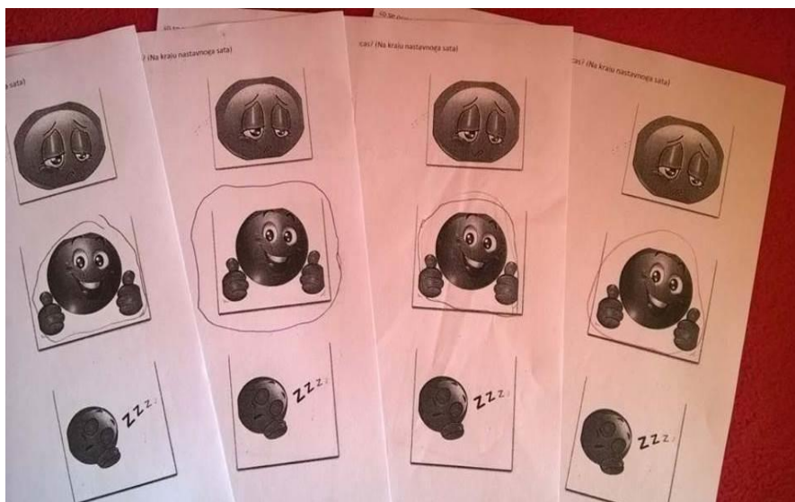
Sl. 5 Evaluacijski listići u završnoj etapi sata