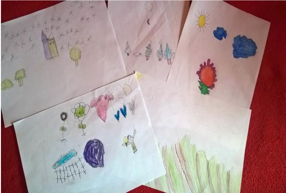
Sl. 7 Nedefinirane ilustracije