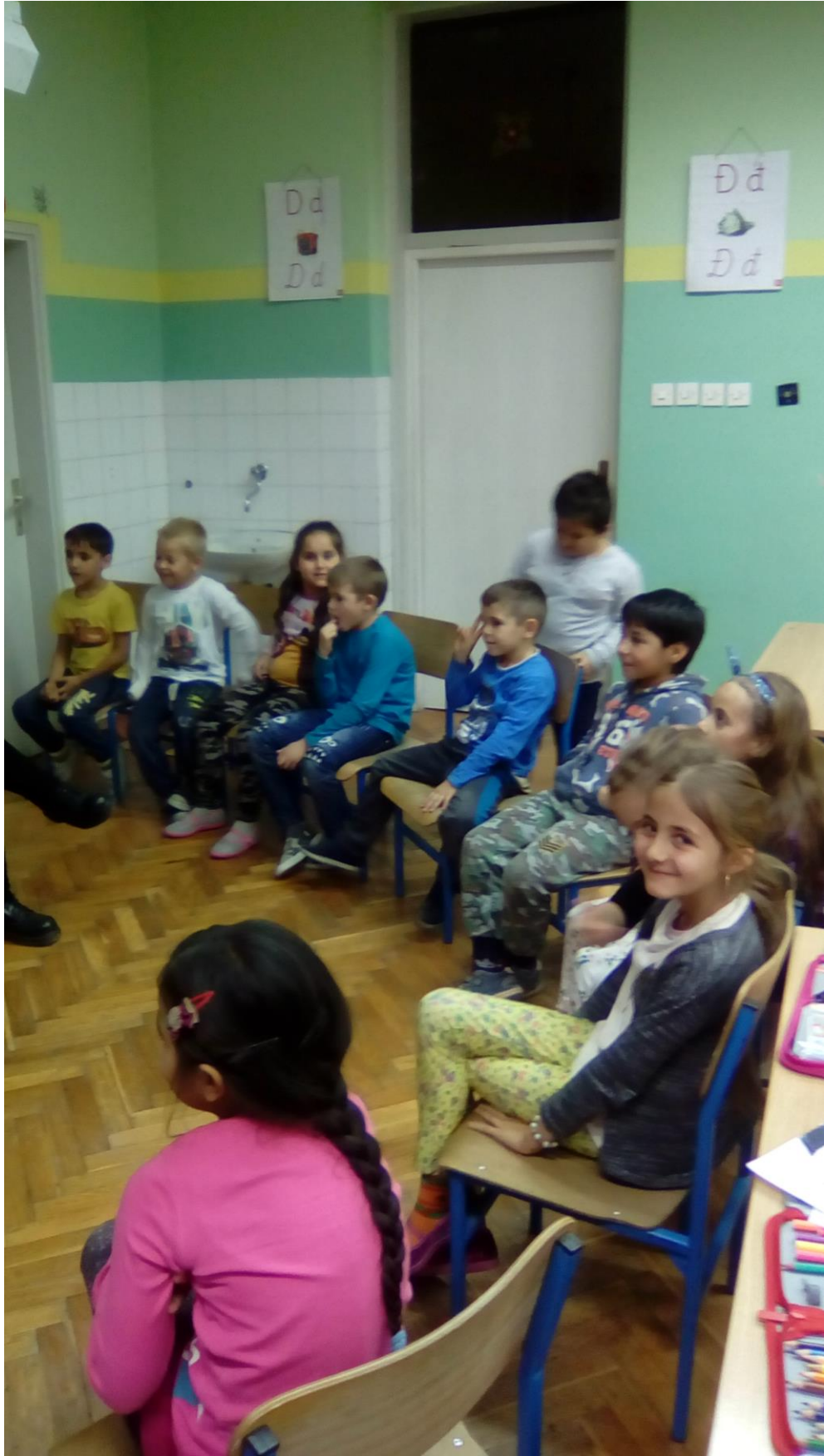
Sl. 2: Glavni dio sata