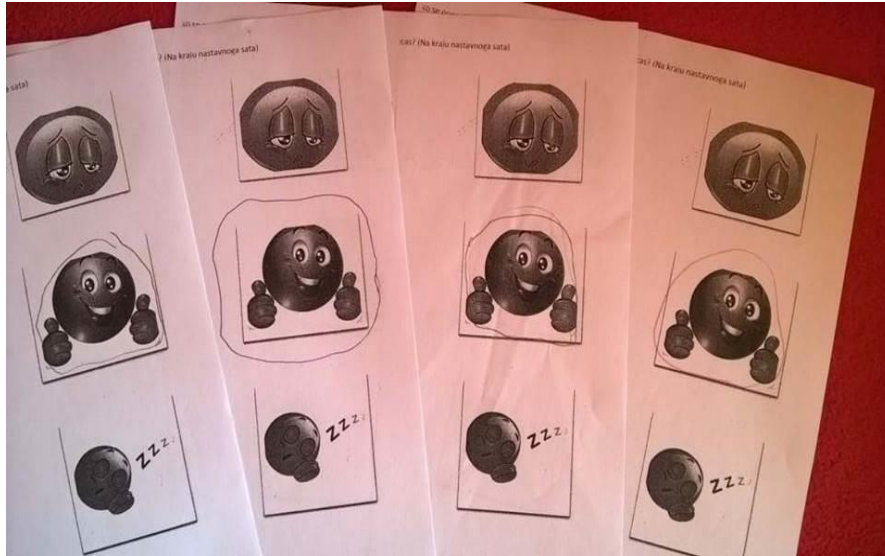
Sl. 5 Evaluacijski listići u završnoj etapi sata