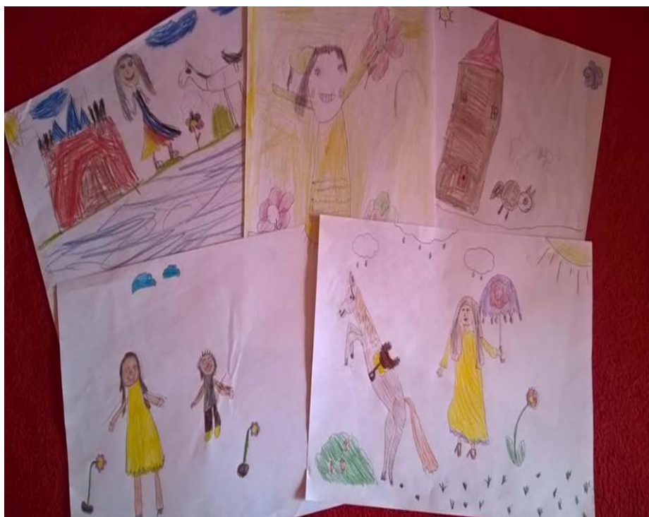
Sl. 6 Ilustracije Ljepotice i zvijeri

Po završetku četvrte radionice, iznesena su opažanja i zaključci. U prvoj etapi sata učenici su bili iznimno zainteresirani za radionicu. S obzirom da su u prethodnoj radionici već gledali crtani film, ovoga su puta bili dodatno zainteresirani. Budući da govorimo o prvome razredu osnovne škole, odnosno djeci koja su još uvijek većinski u skupini lošijih čitača, odlučili smo se za sinkronizirani crtani film. Taj je odabir uvelike pridonio koncentraciji djece i film je u potpunosti zaokupio njihovu pažnju. U posljednjih dvadeset minuta filma djeci je popustila koncentracija i zainteresiranost za film. Možemo zaključiti da je razlog tome što se u prethodnome filmu ipak radilo o pravim likovima iz bajke, dok smo ovoga puta gledali bajku čiji su glavni junaci psi. U prilogu su ilustracije omiljenoga dijela iz filma, pri čemu je učenicima ponuđeno da mogu ilustrirati omiljeni dio iz jednoga od ova dva filma. Većina se razreda odlučila ilustrirati Ljepoticu i zvijer , dok na nekoliko radova uopće nije bilo moguće raspoznati što je ilustrirano. Na Slici 6 prikazane su ilustracije Ljepotice i zvijeri, dok Slika 7 prikazuje onu skupinu radova na kojima je nemoguće razaznati što su učenici željeli ilustrirati.