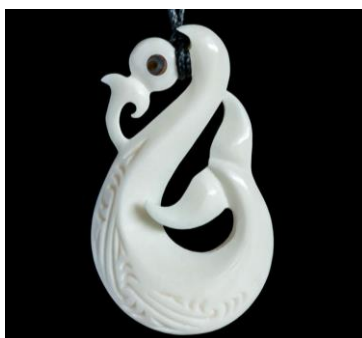
Slika 16.: privjesak Manaia