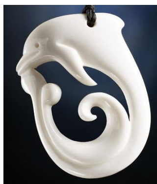
Slika 15.: privjesak papahu