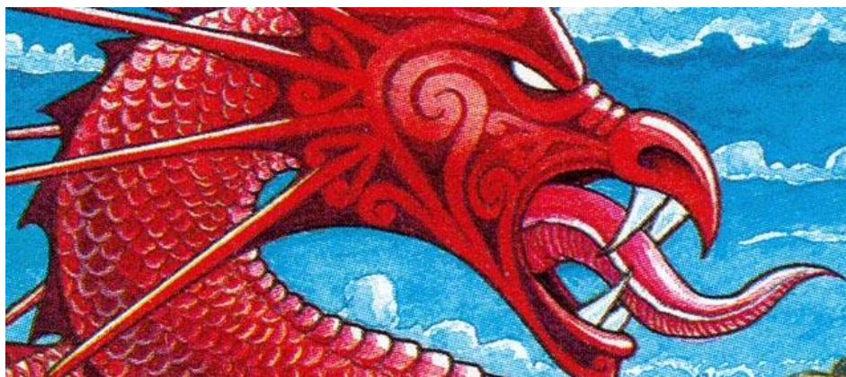
Slika 3.: taniwha