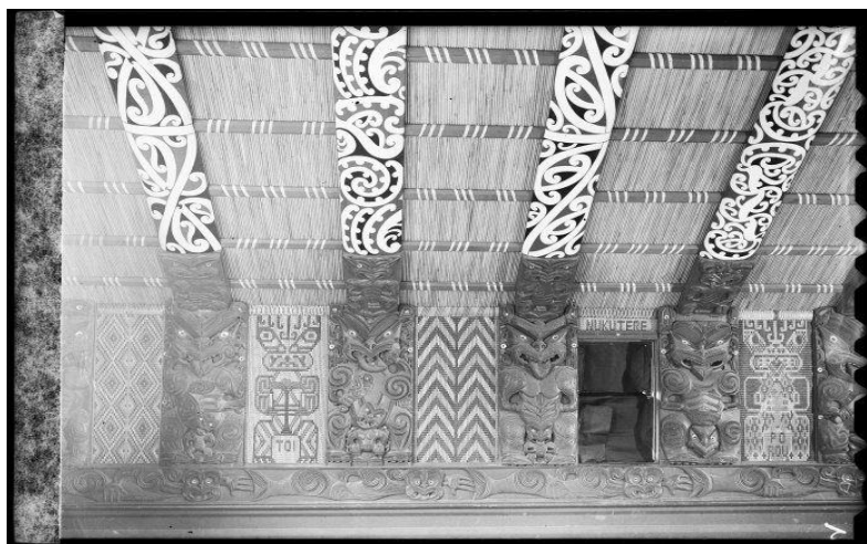
Slika 10.: uzorak kōwhaiwhai iz plemenske kuće