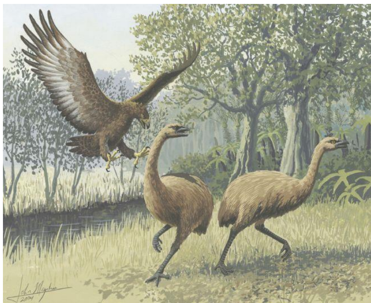
Slika 2.: ptica Hakawai