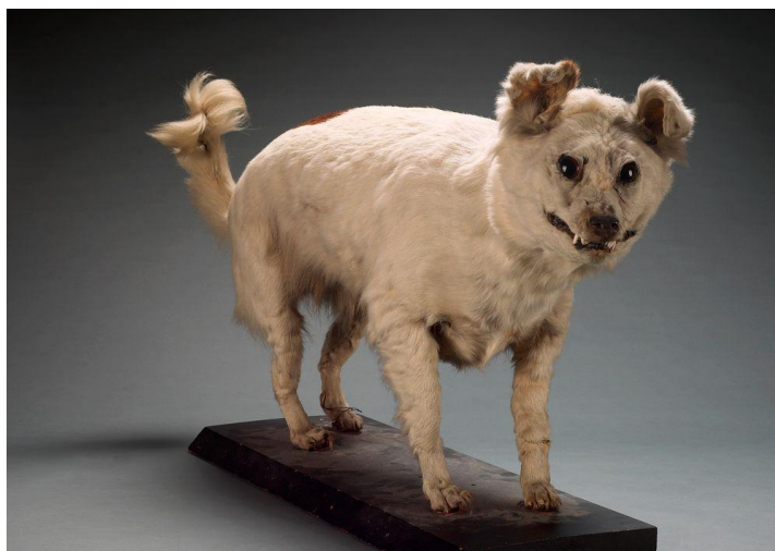
Slika 9.: pas kurī