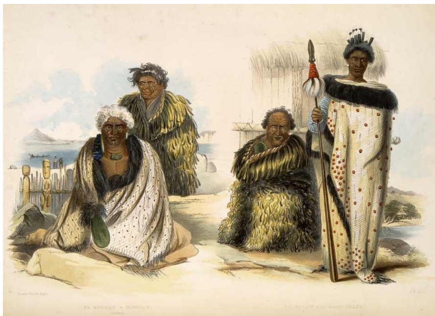
Slika 11.: Plemenski vođe u raukura -plaštevima