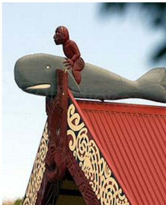
Slika 6.: Paikea – jahač kitova