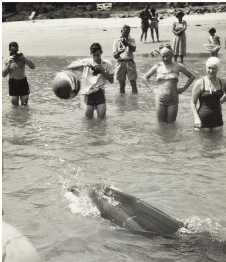
Slika 7.: dupin Opo