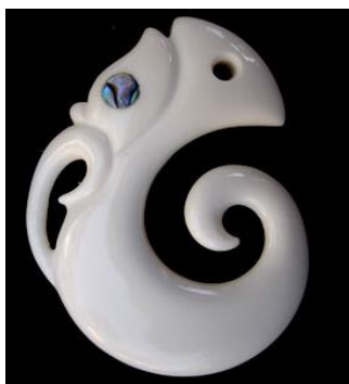
Slika 17.: privjesak Koropepe