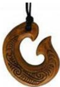
Slika 13.: privjesak matau