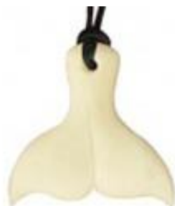
Slika 14.: privjesak muri parao