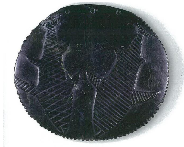
Slika 12.: disk s ribljim uzorkom iz Zaljeva Okains