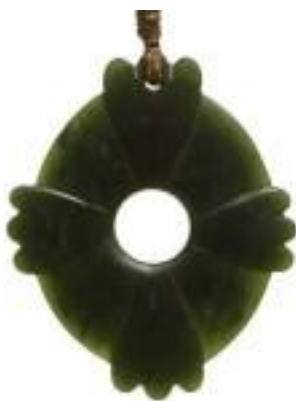
Slika 18.: prsten kākā