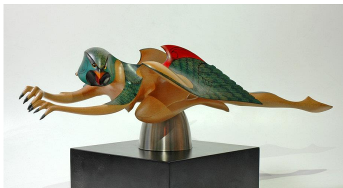
Slika 8.: Kurangaituku