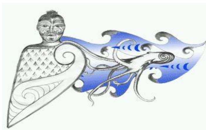
Slika 4.: Kupe i Muturangi