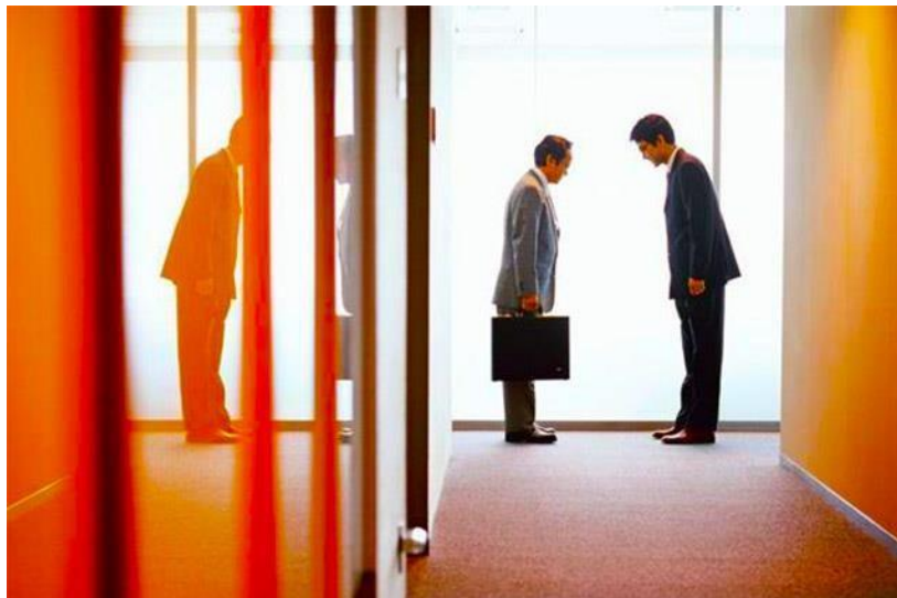
Slika 3. Komunikacija s ljudima iz dalekih kultura