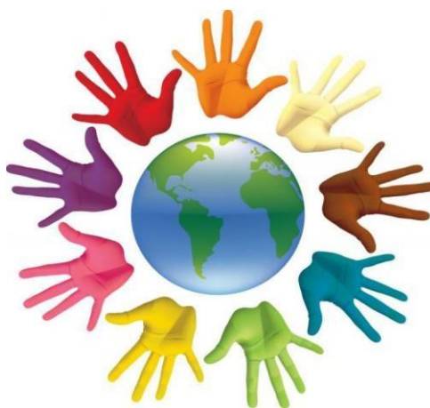
Slika 4. Raznolikost kultura na Zemlji