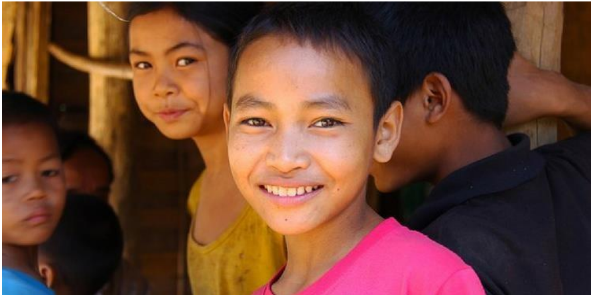
Slika 2. Neverbalna komunikacija u različitim kulturama