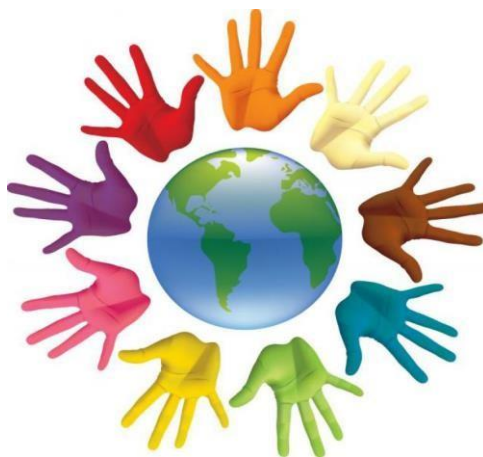
Slika 4. Raznolikost kultura na Zemlji

Izvor: preuzeto u cijelosti, (Google.hr 2017)