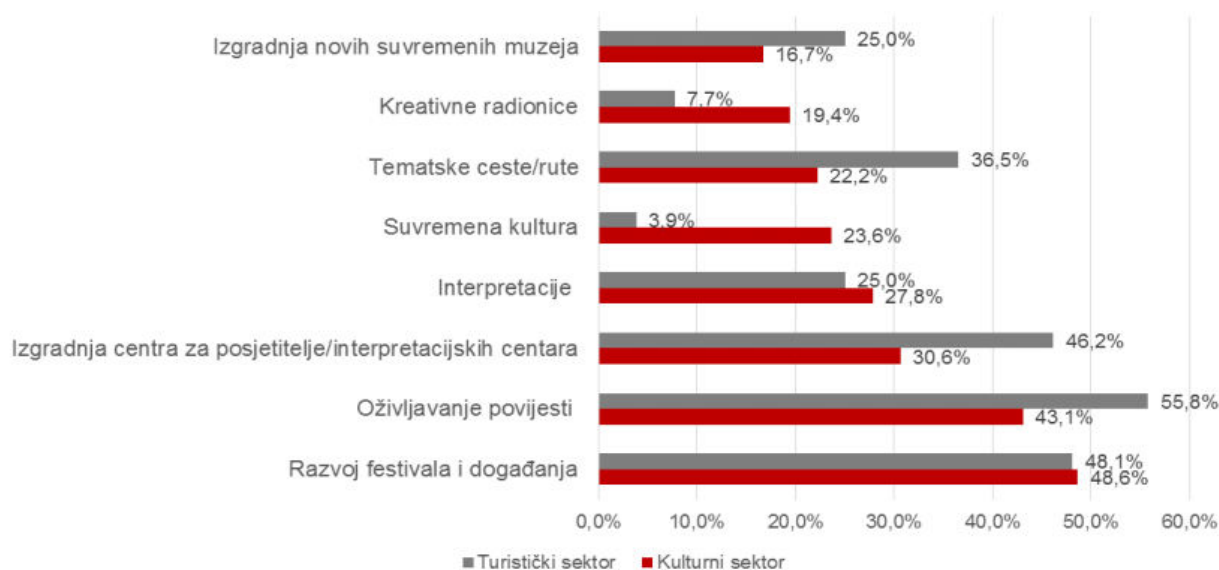
Tablica 4. Prioritetni kulturno-turistički proizvodi

Izvor: Boranić Živoder, Tomljenović, Akcijski plan razvoja kulturnog turizma, str. 17